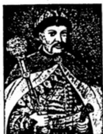
EX LIBRIS Э. ГЕТМАНСКОГО