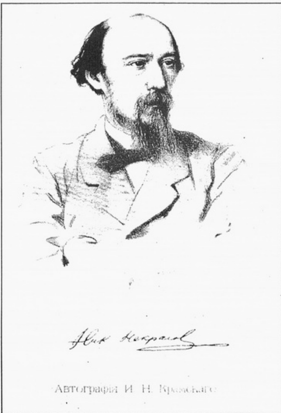
Автографія І. Н. Крамського

Прижиттєвий портрет російського поета й видавця Миколи Олександровича Некрасова. 1877. Автолитографія І.М.Крамського.