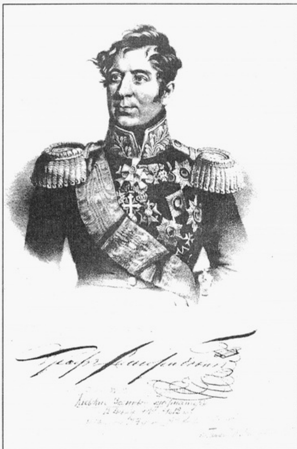
Портрет київського військового губернатора графа Михайла Андрійовича Милорадовича. Не пізніше 1882 р. Літографія П.Ф.Бореля. Дарунок графа Г.О.Милорадовича.

виразності. Митець зобразив представників аристократії - князя Клеменса Меттерніха та графа Йозефа Естергазі, мистецьких кіл - композитора Йоганна Штрауса (батька)