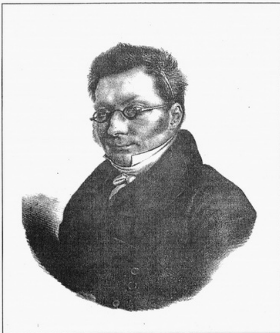
Прижиттєвий портрет декабриста барона Володимира Івановича Штейнгеля. 1823. Автолитографія О.Г.Естеррейха.

У статті розповідається про підбірку графічних портретів з колекції сектора естампів та репродукцій Національної бібліотеки України імені В.І.Вернадського, характеризується творчість у жанрі портретної графіки таких митців різних національностей, як Й.Кригубер, О.Естеррейх, П.Ф.Борель, А.Муільрон, Ф.Красицький.