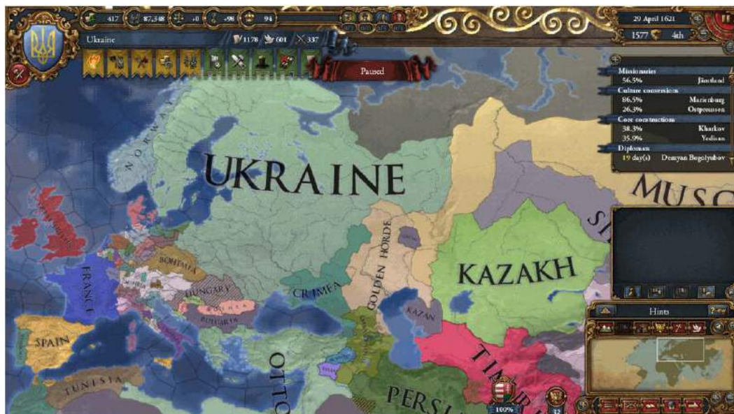
Рис. 2.4. Граємо за Україну #1: найкращі ігри.

ядерної зброї у цій грі виглядає дуже круто і спробувати можна. Звичайно, в житті нічого крутого в цьому немає, але не пропадати ж добру в грі!