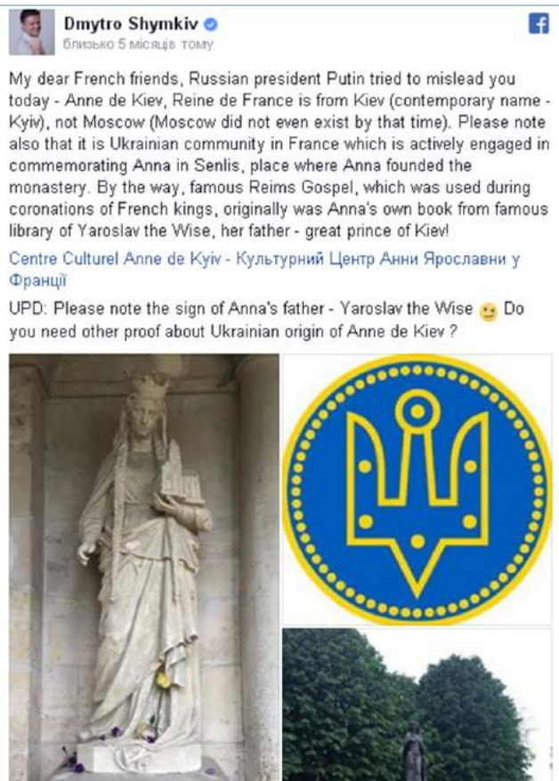
Рис. 2.3. Допис Д. Шимківа у Facebook

королевою франків, а Київ був столицею Русі. Російської столиці Москви взагалі тоді не існувало аж до 1147 р. У Франції київську принцесу називають Анною Київською, а українці, як підкреслює видання, абсолютно справедливо розглядають її як одну з постатей своєї національної історії. Тож, як пише французька газета, Путін здійснив спробу «анексувати» княжну Анну, зробивши з неї росіянку. Ба більше, росіяни дедалі гучніше називають київського князя Ярослава Мудрого одним з перших російських монархів. Французький часопис додає, що це все одно, якби французи називали римського імператора Юлія Цезаря першим французьким королем [46].