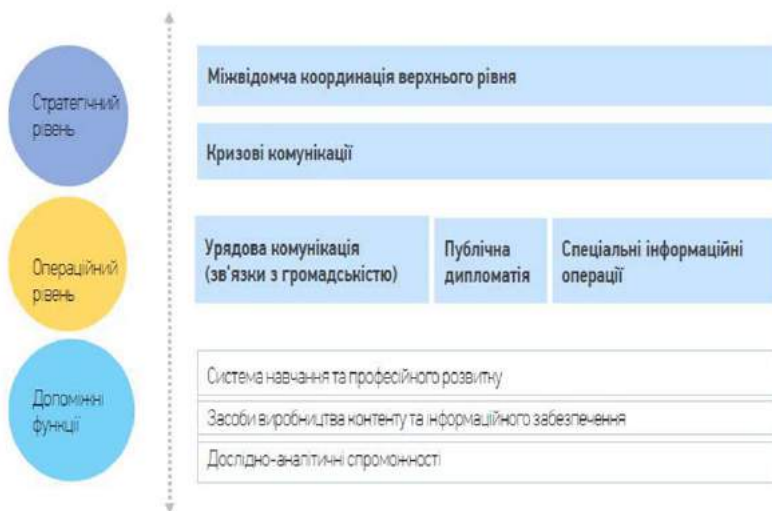
Рис. 3.2. Модель державної системи стратегічних комунікацій