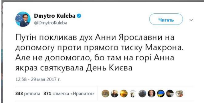
Рис. 2.2. Допис Д. Кулеби у Twitter.

де вона заснувала монастир, та порадив звернути увагу на знак Ярослава Мудрого: «Невже потрібні ще якісь докази походження Анни Київської?»