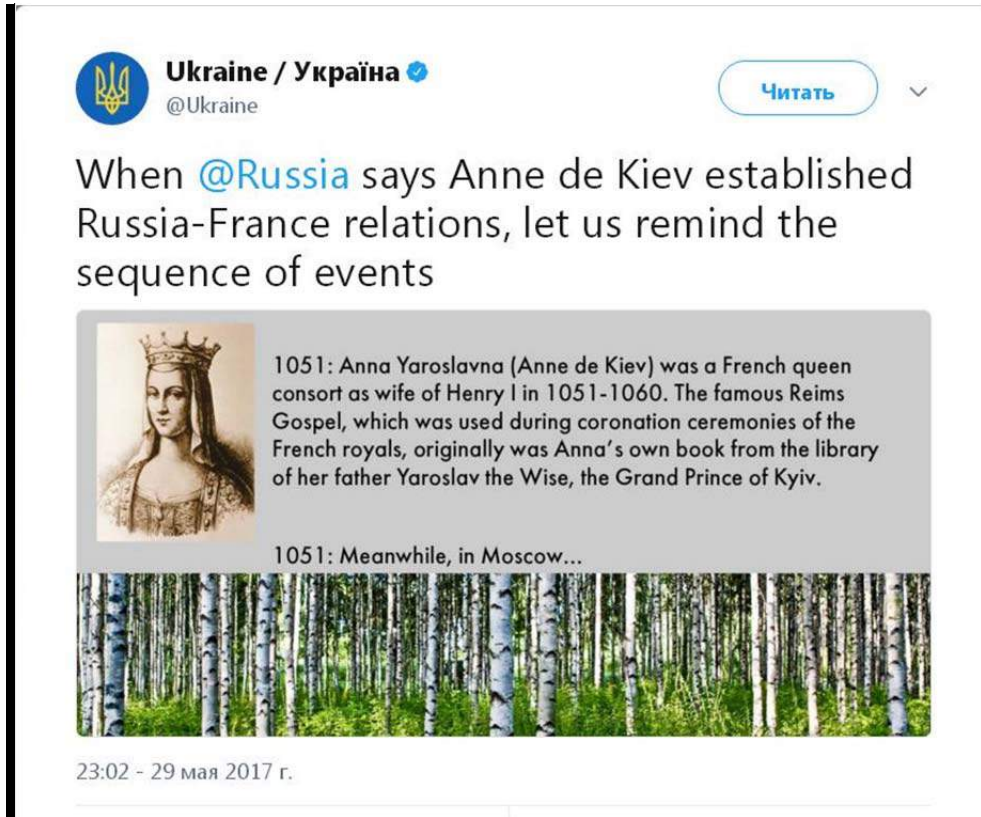
Рис. 2.1. Допис офіційного акаунту України у Twitter.

вових боргерів та інтенсивність дискусій – кількість коментарів та інших форм включеності аудиторії.