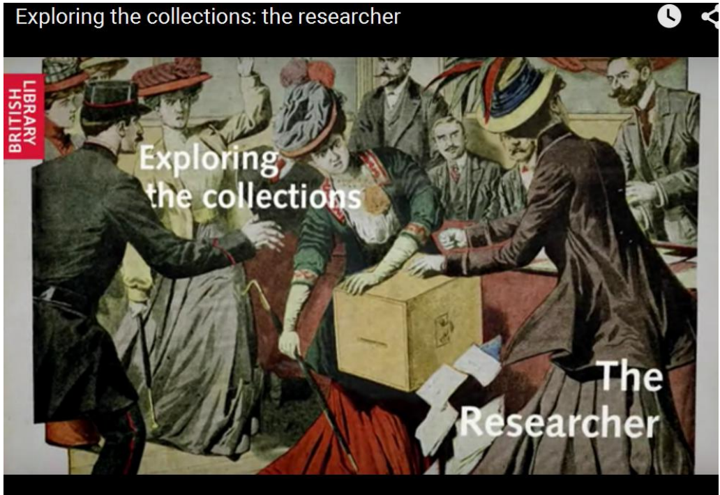
Рис. 2.1. Вивчаючи колекції: дослідник (Exploring the collections: the researcher)

числі колекції оцифрованих документів, можуть бути використанні в процесі роботи над дисертацією ( https://www.youtube.com/watch?v=MtFuIs_MIRw ) (рис. 2.1).