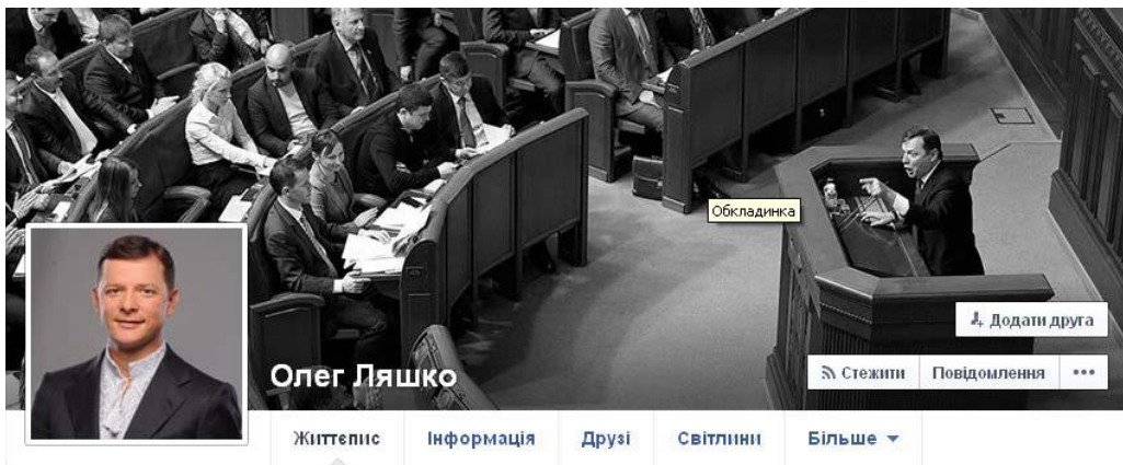
Рис. 3.2. Обкладинка сторінки Радикальної партії О. Ляшка у Facebook

Партійний сайт забезпечує переходи на сторінки партії в соціальних мережах. Станом на 14 квітня 2015 р. партія була представлена в мережах Facebook, Twitter, «ВКонтакте» та YouTube. Показовим є концентрація уваги на особистості лідера Радикальної партії О. Ляшка, ім'я якого було інтегровано в назву партії, а зображення прикрасили партійні сайт і мережеві сторінки (рис. 3.2).