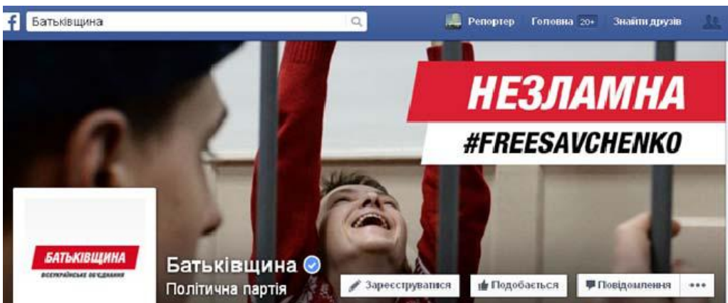
Рис. 3.1. Обкладинка сторінки «Батьківщини» у Facebook

Автори повідомлень акцентують увагу на актуальних проблемах, які цікавлять багатьох пересічних громадян. Зокрема, після виборчої кампанії 2014 р. значна увага приділялася темі арешту Н. Савченко, якій приділялася значна увага не лише під час виборчої кампанії «Батьківщини», а і в пост-виборчий період. Показово у зв'язку з цим, що обкладинка сторінки «Батьківщини» у Facebook містить зображення Н. Савченко з надписом «Незламна» (за аналогією з однойменним фільмом, який демонструвався в цей час в кінотеатрах України) та хештегом #FREESAVCHENKO (рис. 3.1).