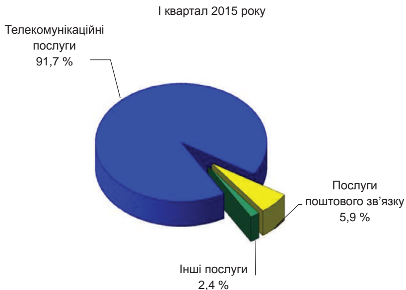
Рис. 1.1. Економічні показники інформаційної сфери