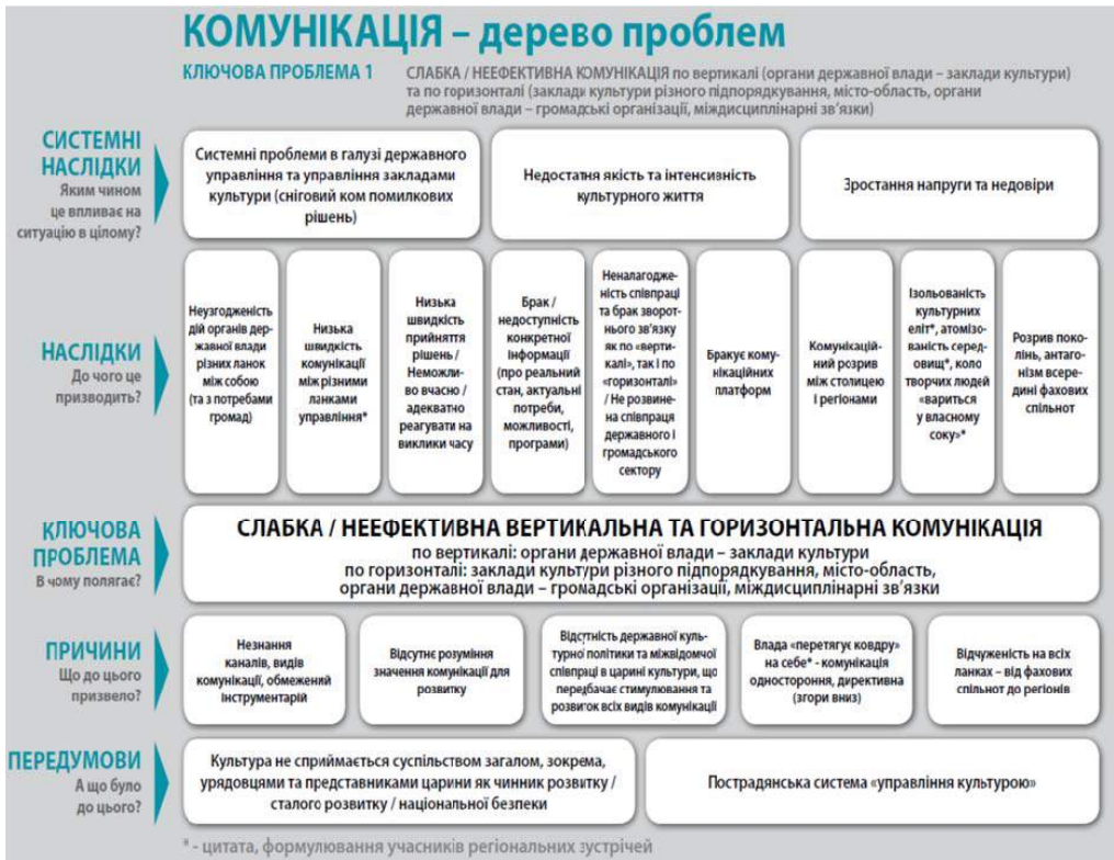
Рис. 5.1. Комунікація – дерево проблем [19]

Причини: брак кваліфікованих кадрів з комунікації в культурних установах, нерозуміння цілей та значення зовнішньої комунікації для розвитку культури, відсутність державної політики, спрямованої на підтримку та просування культури, відсутність розуміння загальних проблем у культурі, маргіналізація сфери культури, закритість від громадськості.