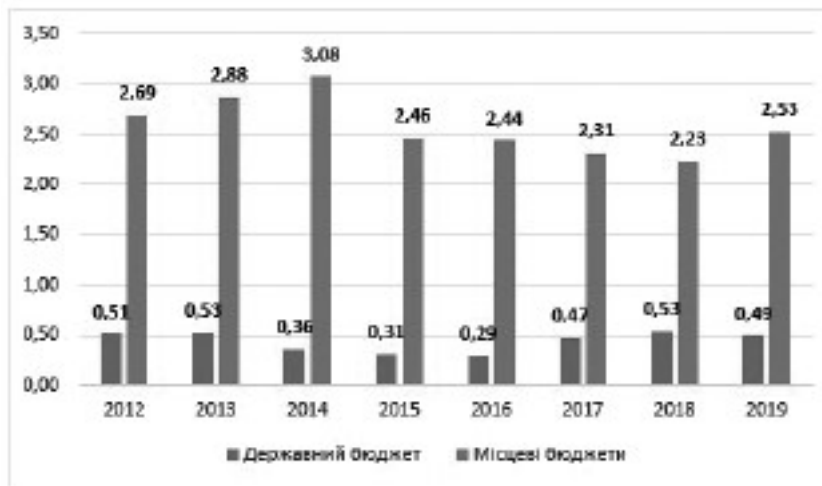
Діаграма 1. Частка видатків на культуру та мистецтво у структурі державного та місцевих бюджетів у 2012-2019 роках, відсотків

– За наявного механізму фінансування під час розподілу видатків місцевих бюджетів сфера культури перебуває на останніх позиціях. Крім того, у структурі видатків місцевих бюджетів за 2014-2018 роки спостерігається стійка тенденція до зниження частки видатків, що спрямовуються на культуру і мистецтво. Водночас частка видатків з державного бюджету у визначений період має тенденцію до зростання (Діаграма 1.). Співвідношення видатків, що спрямовуються з державного та місцевих бюджетів на культуру та мистецтво, змінюється у 2019 році, однак збільшена порівняно з 2018 роком частка видатків з місцевих бюджетів не досягла рівня 2014 року.