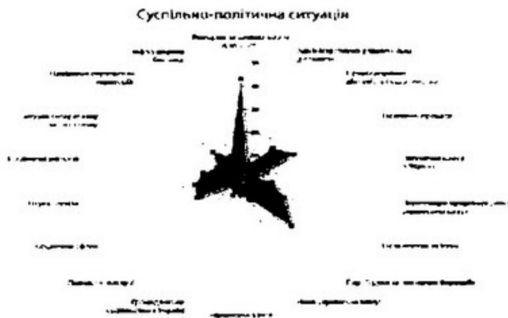
Рис. 3. Дані інфографічного звіту інформаційно-аналітичних підрозділів НБУВ

Інформаційно-аналітичні підрозділи НБУВ зі свого боку використовують прийоми візуалізації для висвітлення інформаційно-аналітичної та видавничої діяльності (див. рис. 3). Запропонована інфографіка ілюструє тематику аналітичних матеріалів, яку підготували протягом 2014 р. Служба інформаційно-аналітичного забезпечення органів державної влади та Національна юридична бібліотека НБУВ.