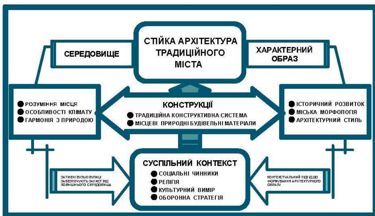
Рис.4. ПРИНЦИПИ СТІЙКОГО ПІДХОДУ ДО ПРОЕКТУВАННЯ В ІСТОРИЧНОМУ СЕРЕДОВИЩІ АРАБЬСЬКОГО МІСТА

На сучасному етапі не можна заперечувати досягнуті результати, які є основою для масштабного відновлення пошкодженого житла, подальшого розвитку житлового будівництва. Архітектурно-планувальні завдання необхідно вирішувати комплексно з містобудівними, не тільки в контексті приведення міських просторів до рівня мінімального комфорту, але і стійкого розвитку з урахуванням соціокультурних, економічних і екологічних аспектів проектування (використання відповідних будівельних матеріалів), архітектурних особливостей і культурної ідентичності регіонів Лівії, держави в цілому (Рис.4).