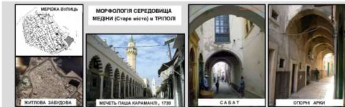
Рис.2. СТРУКТУРА АРАБСЬКОГО МІСТА