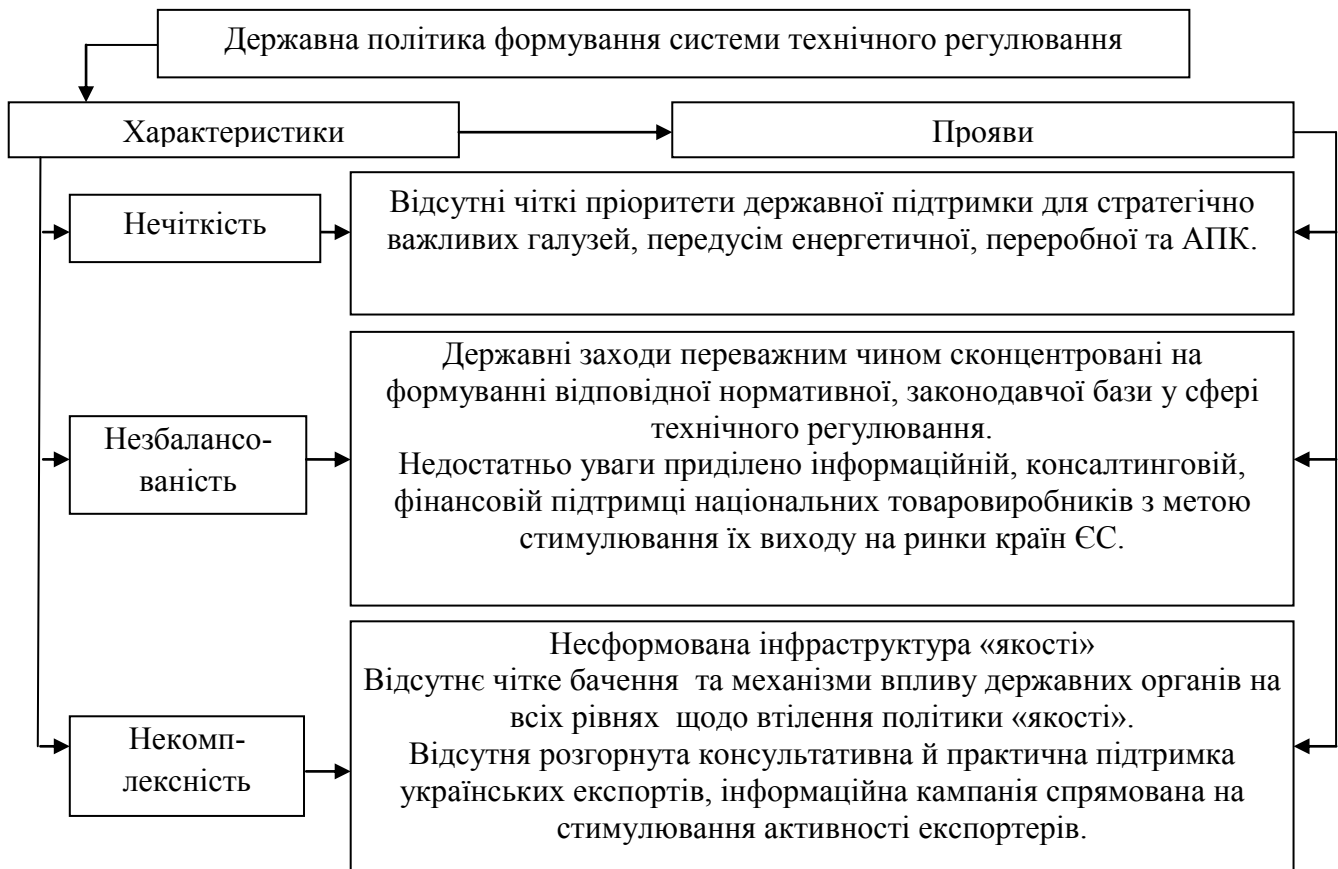
Рис. 3. «Вузькі місця» державної політики України у сфері формування гармонізованої системи технічного регулювання

Гальмування реформ у сфері технічного регулювання, як показав аналіз факторів у рамках оцінки процесу гармонізації системи технічного регулювання, пояснюється також недостатньою активністю урядових структур, неготовністю українських виробників використовувати у повному обсязі можливості, що відкриваються на ринках ЄС.