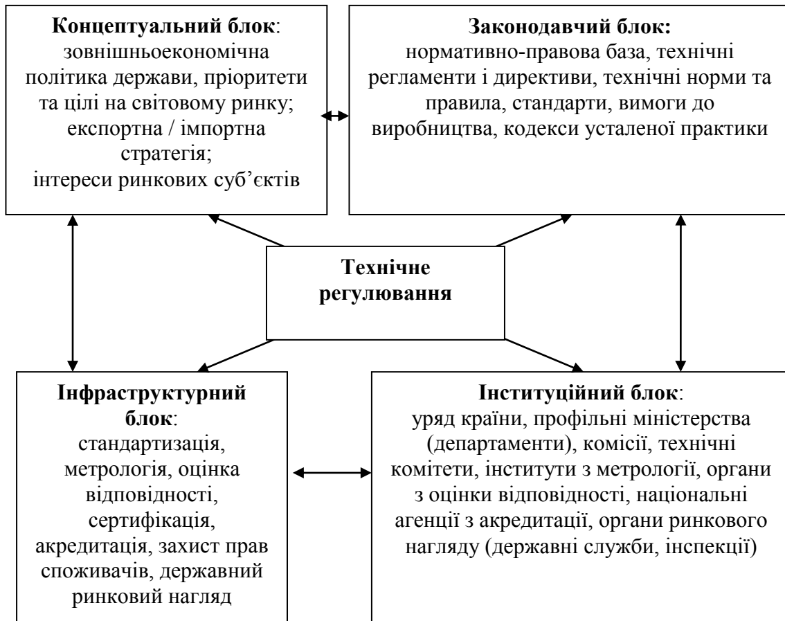
Рис. 1. Система технічного регулювання країни

Автором відстежено сутнісну відмінність терміну «гармонізація» від споріднених термінів «уніфікація», «адаптація» законодавчо-правової бази країни, оскільки гармонізація адекватніше та ємніше за інші терміни відображає сутність процесу створення гомогенного правового середовища в рамках європейських інтеграційних об'єднань відповідно до моделей, запропонованих інститутами ЄС. Відстежено термінологічну логіку поняття «гармонізація системи технічного регулювання», сутність якої полягає у причинно-наслідковій послідовності: диференціація соціально-економічного розвитку країн, створення системи технічного регулювання, виникнення технічних бар'єрів у міжнародній торгівлі між країнами, виникнення потреби у гармонізації системи технічного регулювання країн, реалізація процесу гармонізації системи технічного регулювання країн до прийнятого в інтеграційному об'єднанні стандарту, збільшення ефективності експортної політики країни у міжнародній торгівлі (рис. 2).