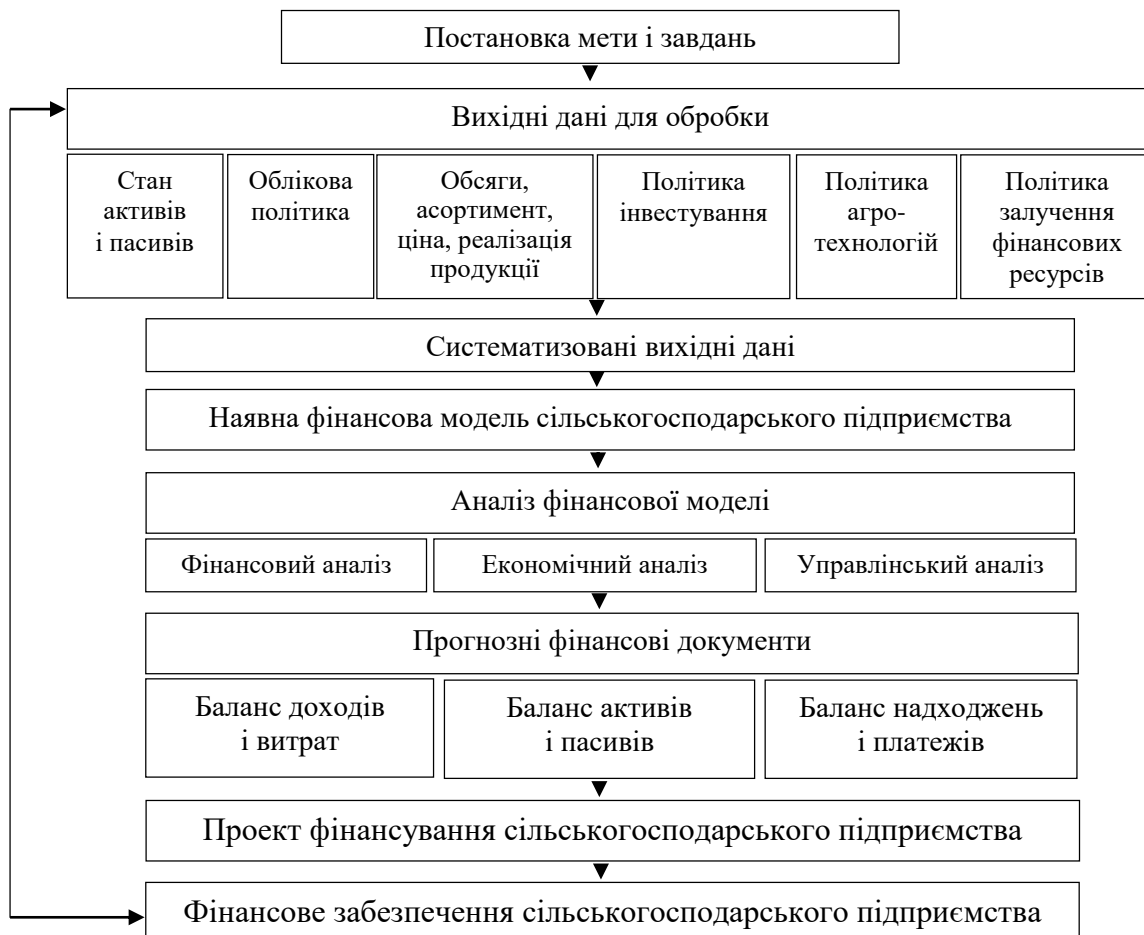
Рис. 1. Послідовність розроблення стратегії фінансового забезпечення сільськогосподарського підприємства*

Доведено, що досягти позитивних результатів діяльності суб'єктів господарювання й забезпечити їхню конкурентоспроможність можливо тільки за достатнього фінансового забезпечення. Під час розроблення стратегії формування фінансового забезпечення сільськогосподарських підприємств (рис. 1) ураховуються фінансово-економічні та суспільні тенденції: політична нестабільність, недосконалість бюджетної, податкової, цінової, кредитної політики, постійні зміни нормативно-правової бази, інфляція, значні коливання курсу національної валюти тощо.