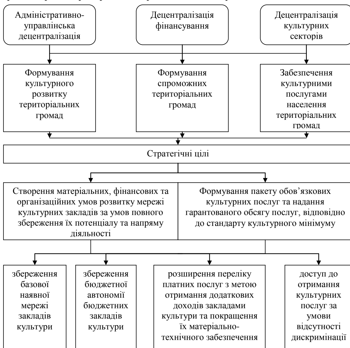
Рис. 3. Концептуальна модель розвитку сфери культури в Україні на рівні територіальних громад

Принципово заперечується можливість використання жорсткого впливу держави на об'єкти сфери культури. Висловлено аргументи на користь концепції їх підтримки, класифікуючи фінансовий механізм як економічний, оскільки йдеться про фінансову, пільгову, податкову підтримку, стимулювання добродійництва й меценатства, інвестиції для сприяння розвитку мережі недержавних організацій. Концептуальну модель розвитку сфери культури в Україні на рівні територіальних громад подано на рис. 3.