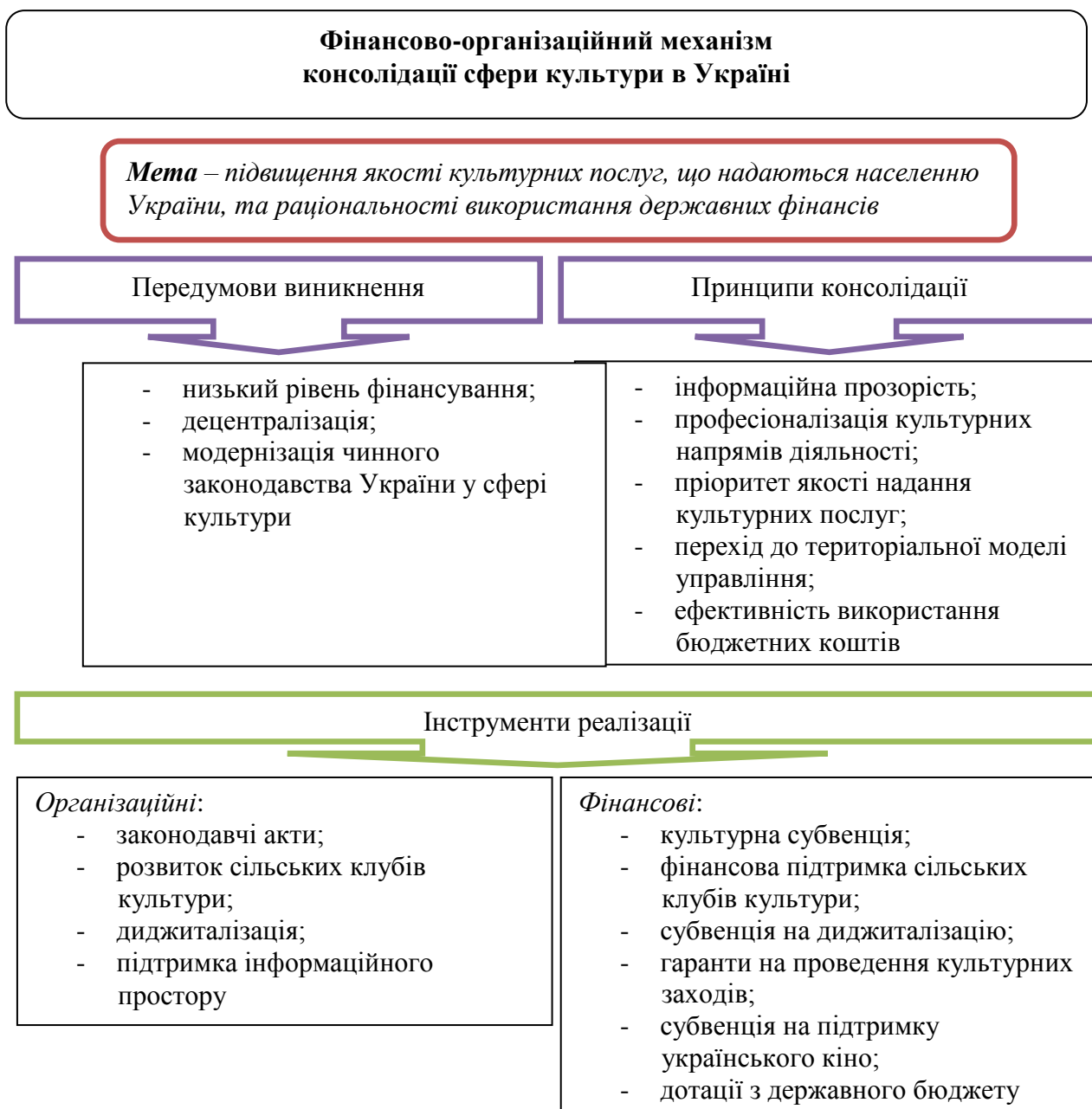
Рис. 2. Фінансово-організаційний механізм консолідації культурної сфери в Україні

Нині фактично основним механізмом фінансування сфери культури є змішане фінансування, що функціонує на основі використання програмно-цільового методу виділення коштів на сферу культури, ефективність якого забезпечується об'єднанням грошових коштів з власне бюджетного фінансування та самофінансування, що набуває відображення, відповідно, у загальному й спеціальному фондах бюджетів різних рівнів і відповідних кошторисів.