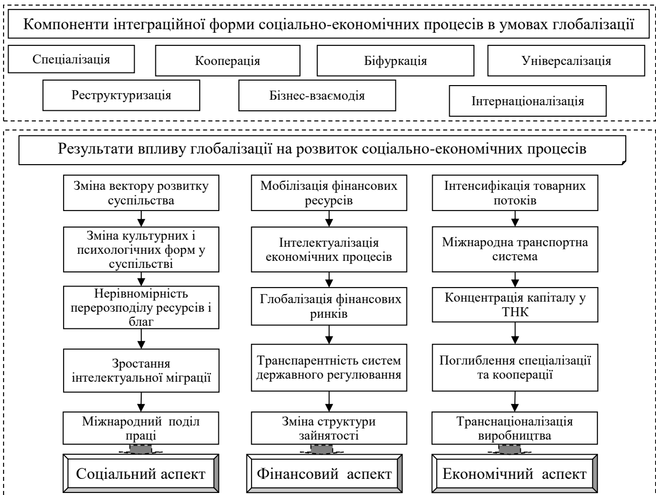
Рис. 1. Концептуальна підтримка складових інтеграції та результатів впливу глобалізації на розвиток соціально-економічних процесів у національній економіці

Важливим етапом на шляху структуризації факторів стійкого зростання національної економіки є покращення окремих сегментів ресурсного потенціалу, у тому числі, виробничого, інституційного та людського, що є необхідною умовою довгострокового вирішення питань в суспільстві та у суб'єктів мезо- та макроекономічного рівня. Аналіз еволюційних шляхів та наукових підходів категорії економічного розвитку та зростання підкреслює їх взаємозалежність та відповідну системність. Наявність полярних поглядів на відповідні дефініції свідчить про довготривалий пошук варіантів щодо змісту та форми розвитку та зростання національної економіки. Визначення певних ознак економічного зростання надає можливість сформулювати ефективну та адаптивну державну політику, яка буде враховувати потенціальні можливості національної економіки, потреби сучасного суспільства та глобалізаційні процеси. Концептуальна підтримка складових інтеграції та результатів впливу глобалізації на розвиток соціально-економічних процесів представлена на рис. 1.