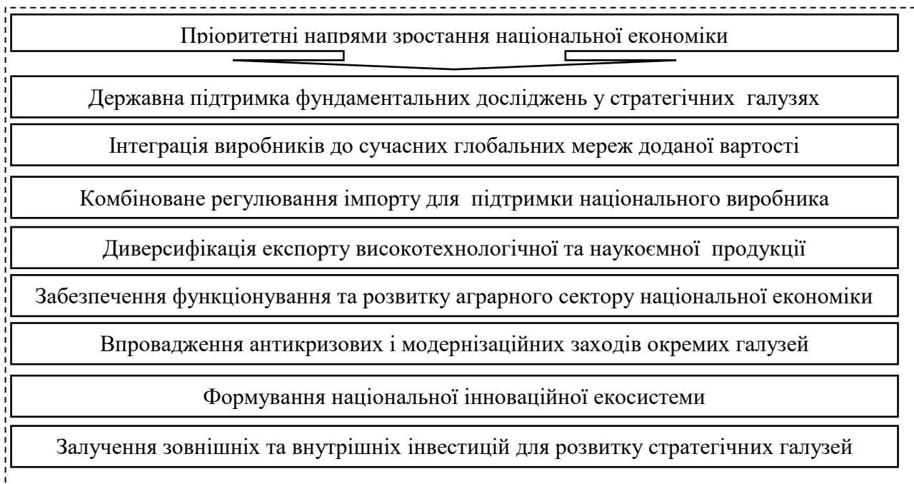
Рис. 2. Пріоритетні напрями забезпечення зростання національної економіки в умовах глобалізації

Процес глобалізації – це сучасна умова функціонування та розвитку національної економіки, яка впливає на процес інтенсивної інтеграції товарних та фінансових ринків, а також сприяє швидкому впровадженню науково-технічних досягнень та оптимізації ефективності виробництва. У дослідженні сформовані пріоритетні напрями зростання національної економіки в умовах глобалізації, які враховують на основі системного та семантичного підходів сегментне моделювання процесів, механізмів, заходів та дій, які забезпечують формування стратегії розвитку, з метою визначення автентичного та перманентного зростання національної економіки під впливом факторів глобалізації (рис. 2).