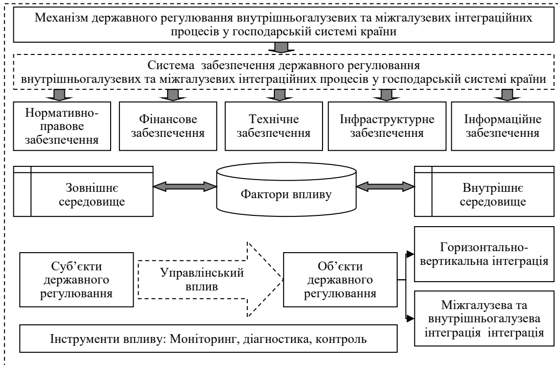
Рис. 5. Механізм державного регулювання внутрішньогалузевих та міжгалузевих інтеграційних процесів у господарській системі країни

Розвиток економічних моделей внутрішньогалузевої та міжгалузевої інтеграції, а також інтеграції національних та іноземних суб'єктів господарювання в рамках процесів глобалізації постає необхідною умовою досягнення стійких параметрів зростання національної економіки та стратегічного розвитку країни під впливом процесів глобалізації. Сучасна внутрішньогалузева та міжгалузева інтеграція підвищує конкурентні можливості у господарській системі країни та особливо важливо, у конкурентній боротьбі у світовому макроекономічному середовищі, але значна внутрішньогалузева та міжгалузева інтеграція може сприяти посиленню монополізації на споживчому ринку.