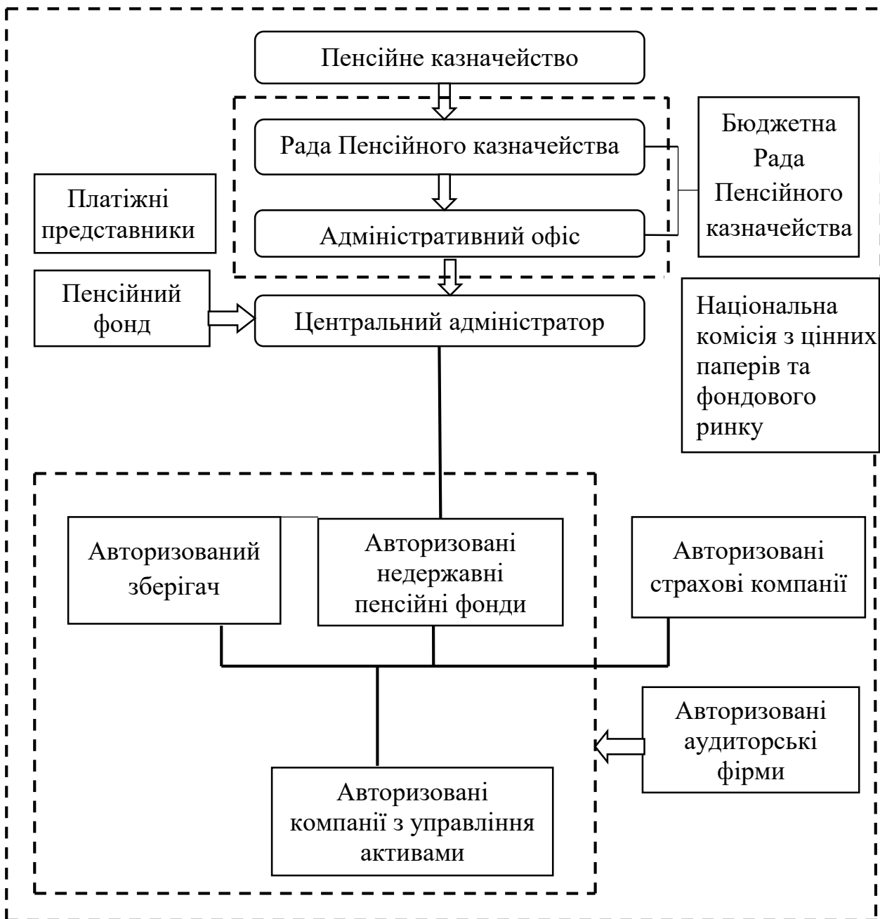
Рис. 3. Інституційна структура системи загальнообов'язкового накопичувального пенсійного страхування

Державний нагляд і державне регулювання в системі загальнообов'язкового накопичувального пенсійного забезпечення має здійснювати Національна комісія з цінних паперів та фондового ринку.