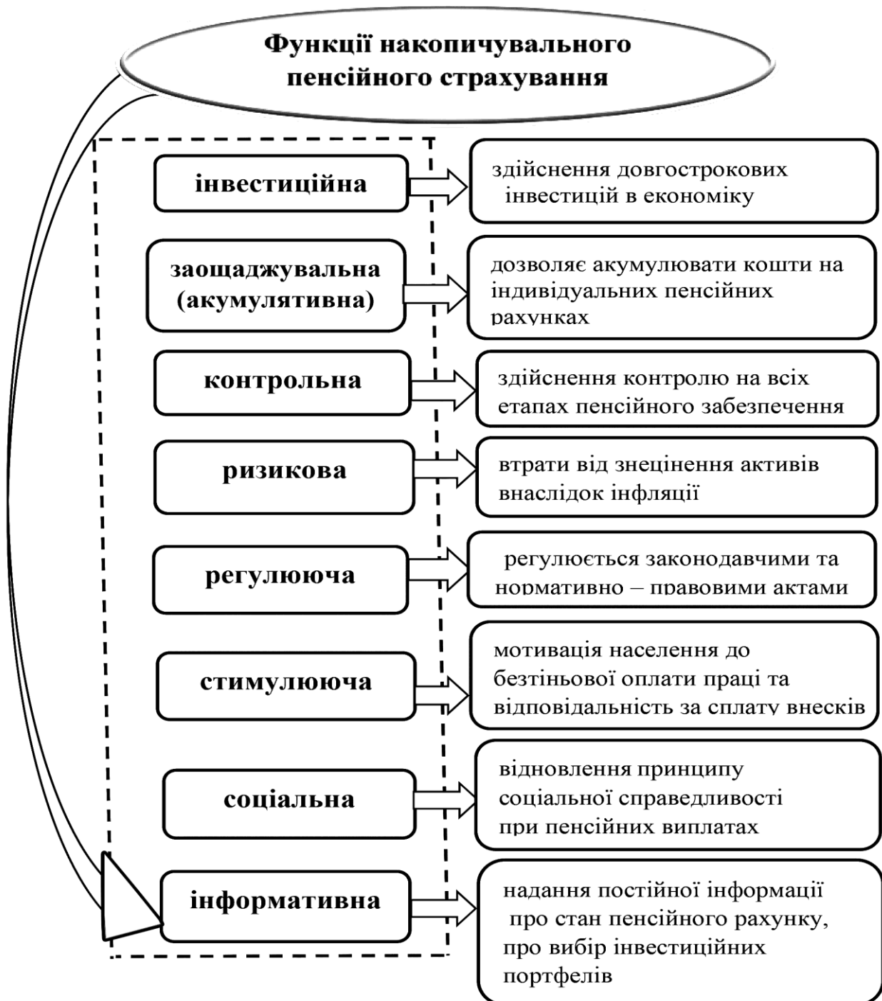
Рис. 1. Функції накопичувального пенсійного страхування

визначили найбільш ефективні з них та встановили, що важливе місце серед них належить використанню накопичувальних пенсійних програм. Проведені дослідження дали змогу удосконалити теоретичний підхід, який передбачає долучення до вже існуючих критеріїв розвиток національних фондових ринків, еволюцію ринкової економіки, стан розвитку другого та третього рівнів пенсійної системи, демографічну ситуацію в країні та в підсумку проведення комплексної оцінки пенсійної системи країни.