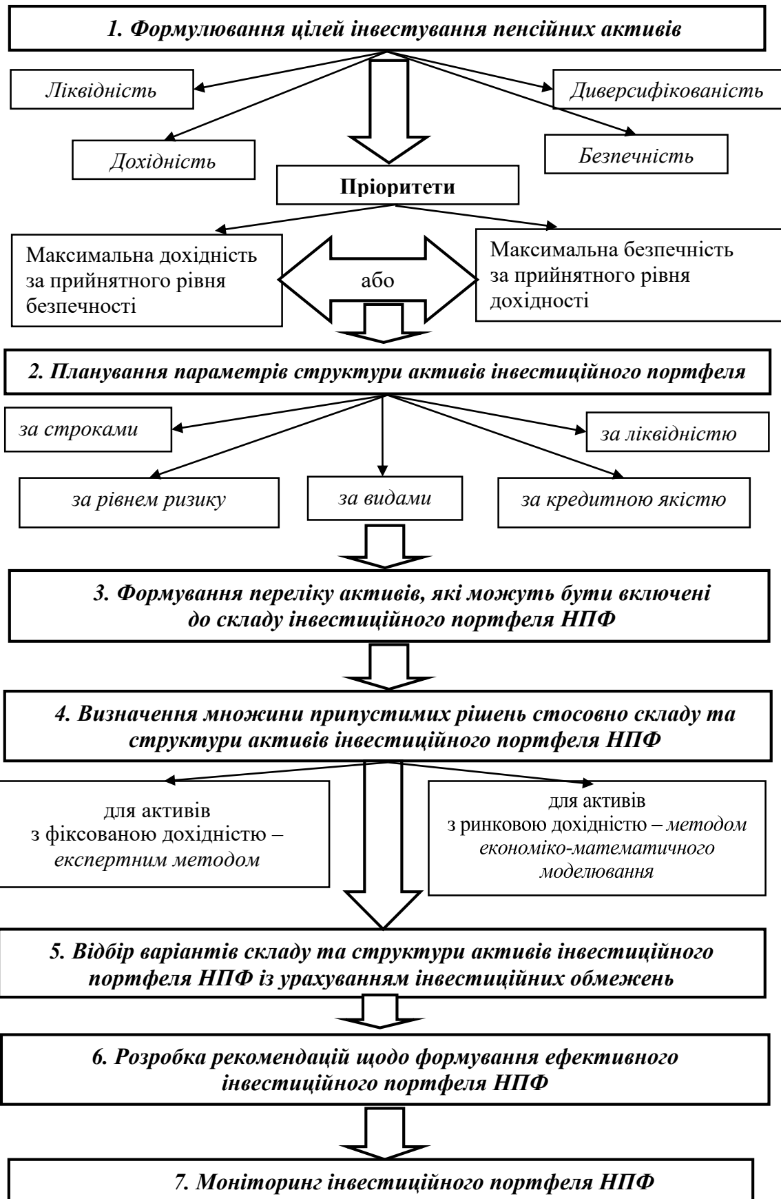
Рис. 2. Механізм формування інвестиційного портфеля НПФ