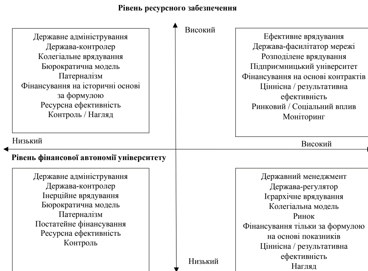
Рис. 3. Матриця «Рівень фінансової автономії університетів – Рівень ресурсного забезпечення»

рівня впливу університету на соціальний розвиток. Третій підхід – поєднання високого рівня фінансової автономії університету та низького рівня впливу університету на соціальний розвиток. Четвертий підхід – поєднання високого рівня фінансової автономії університету та високого рівня впливу університету на соціальний розвиток. Характеристики зазначених підходів відображені у відповідних блоках на рис. 2.