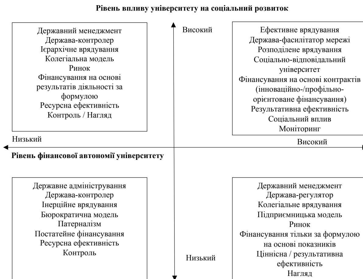
Рис. 2. Матриця «Рівень фінансової автономії університетів – Рівень впливу університету на соціальний розвиток»

Представлені концептуальні рамки розширення фінансової автономії університетів дозволяють інтегрувати різні управлінські моделі, механізми та інструменти та врахувати їх при визначенні підходів до розширення фінансової автономії університетів. Для обґрунтування підходів до розширення фінансової автономії університетів обрано наступні критерії–пари: «Рівень фінансової автономії університету – Рівень впливу університету на соціальний розвиток» та «Рівень фінансової автономії університету – Рівень ресурсного забезпечення». Для визначення та опису підходів до розширення фінансової автономії університетів обрано матричний принцип (рис. 2, 3).