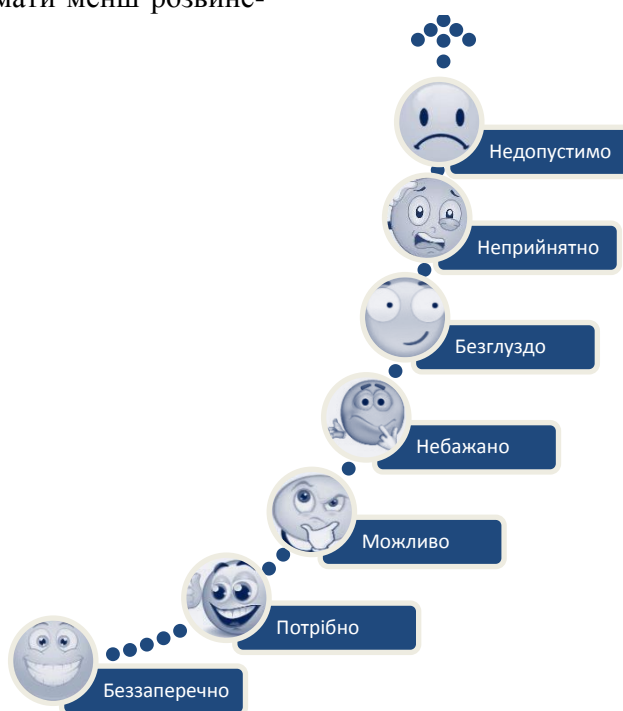
Рис. 2. Ранги сприйняття інформації носіїв соціально-економічного відторгнення

Однак, в розумінні є ще один принциповий момент: оцінювання категорій. Вся інформація, що сприймається людиною має її власний знак оцінювання, наприклад: «безперечно», «авторитетно вірно», «можливо», «емпірично», і навпаки – «не вірно», «неможливо», «припустимо», «виключено». Тобто, інформація, що забезпечує створення соціально-економічного відторгнення, стосуються особистісних поведінкових дій та має ранги сприйняття (рис. 2). Крім того, носії соціально-економічного відторгнення можуть бути одного поведінкового типу, але різного рівня розвитку.