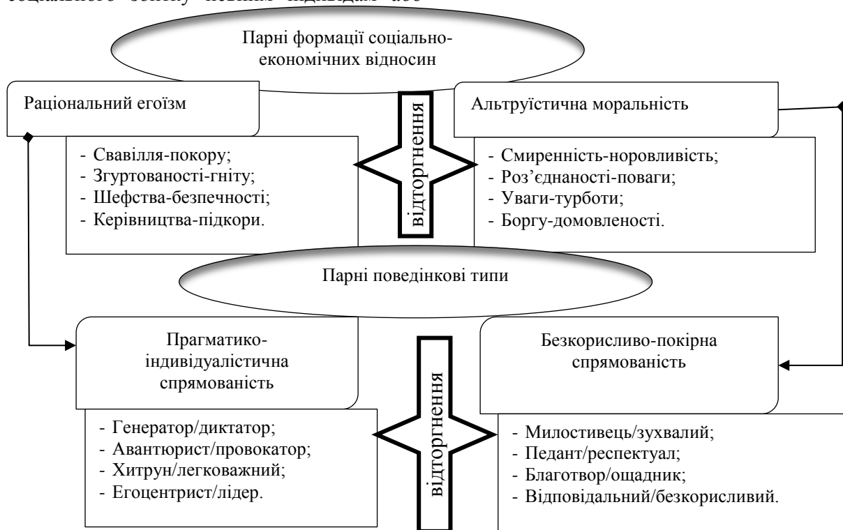
Рис. 1. Базові формації соціально-економічних відносин, що призводять до поштовху відторгнення

соціумам. На них ґрунтується дія більшості діючих загальноприйнятих формацій і поведінкових систем (рис. 1), наприклад: націоналізація багатства, монополізація ринку, соціал-демократія в цілому, а також соціалізм, що захищаються громадськими інститутами та економічними парадигмами сучасності.