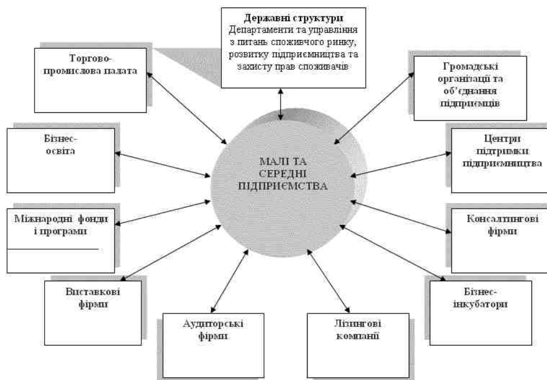
Рис. 2. Інституційний механізм підтримки малого підприємництва

відповідними товарами і послугами за допомогою розвитку альтернативного приватного сектора економіки (кооперативів, індивідуального підприємництва, інших організаційно-правових форм малого та середнього бізнесу) не супроводжується розгортанням відповідного завдання - підтримки інфраструктури підприємництва на селі.