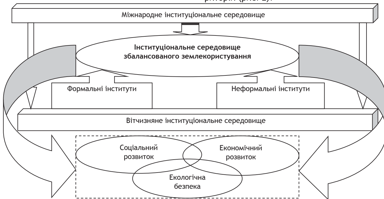
Рис. 2. Модель формування збалансованого інституціонального середовища у сфері аграрного землекористування*

Формування збалансованого інституціонального середовища у сфері аграрного землекористування нами запропоновано розглядати з позиції забезпечення взаємодії певного впорядкованого набору інститутів, що створюється з урахуванням міжнародних, національних, регіональних і локальних інтересів, зорієнтованих на вирішення проблеми досягнення еколого-економічної й соціальної ефективності використання земельних ресурсів у господарській діяльності та для забезпечення розвитку сільських територій (рис. 2).