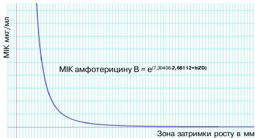
Мал. 2. Графік рівняння регресії – залежності МІК від зони затримки росту.

Дослідниками була описана показова функція з підставою “2”, наше рівняння виявилось більш точним. Отримана та ж показова функція, але по підставі “e” (2,71828...) м з більш значимим ступенем вірогідності моделі, сягаючої 93,1 %. Графік функції отриманого уточненого рівняння регресії наведений нижче, на мал. 2.