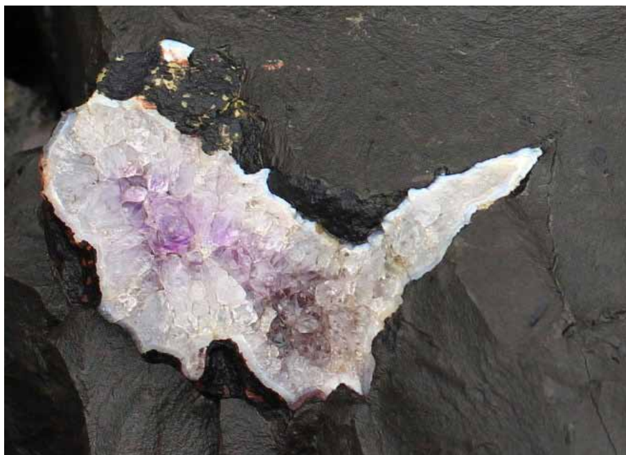
Рисунок 3. Зональна будова мигдалини у базальті. Полицький кар'єр. Довжина мигдалини 10 см

Учені встановили, що за умов коли водяна пара формується на глибині 10-20 м під верхньою частиною потоку, за змін температури і тиску пари вибухають і формуються горизонтальні тріщини, які мають латеральне поширення. На закінченнях цих похилих тріщин утворюються пустоти, для яких тріщини