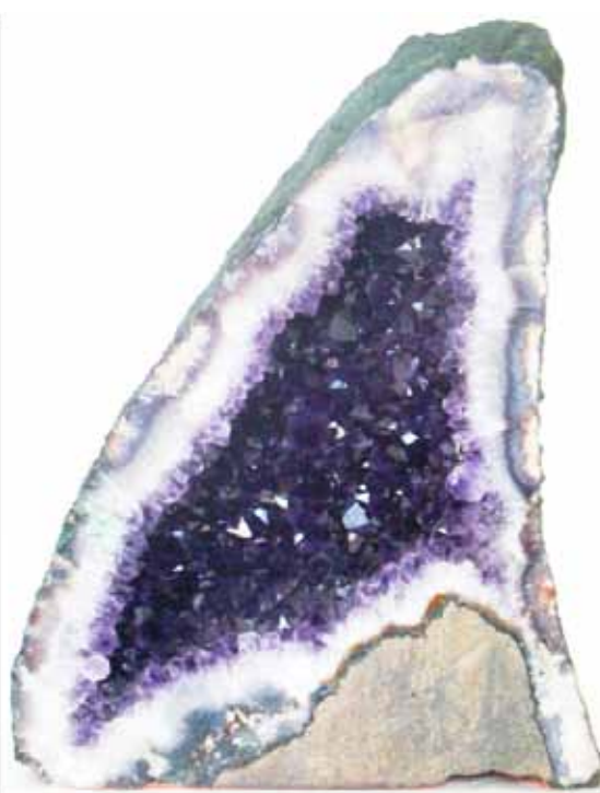
Рисунок 1. Жеода аметисту з родовища Аметіста до Сул, базальтової провінції Парана (з використанням [2], зразок з колекції Геологічного музею ННПМ НАН України, інв. № 2420)