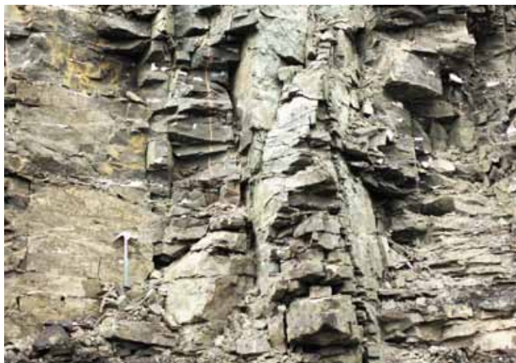
Рисунок 2. Відслонення базальтів у Полицькому кар'єрі з горизонтальними тріщинами та жеодами

Характерно, що форма порожнин, які зустрічаються в розрізі Волинських базальтів, є переважно кулеподібною чи овальною, сильно витягнутою, хвилястою з розгалуженнями. Як відомо, формування таких порожнин (мигдалин) у тілі базальтів пов'язано з процесами охолодження лавового потоку та його дегазації. Вони заповнені різнокольоровими (рожевими, білими, жовтими) цеолітами, крупнолускатим зеленим хлоритом і дрібнозернистим кварцом, халцедоном, агатом, опалом, гірським кришталем, рідко аметистом. Цеоліти представлені переважно радіально-голчастим натролітом, томсонітом, рідко кристалами гейландиту. Цеоліти виповнюють прожилки та мигдалини в базальтах в асоціації з мінералами групи хлориту, анальцимом та низькотемпературним кварцом або