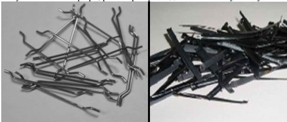
Рис.1. Фібра сталева

Більше 100 років у світі ведуть експериментально-теоретичні дослідження будівельного композиту – сталефібробетону. Даний матеріал широко використовується у країнах Європи у сфері будівництва. Сталефібробетон (СФБ) - це різновид дисперсно-армованого залізобетону. Він виготовляється з дрібнозернистого важкого бетону, де в якості арматури застосовуються сталеві фібри, рівномірно розподілені по всьому об'єму.