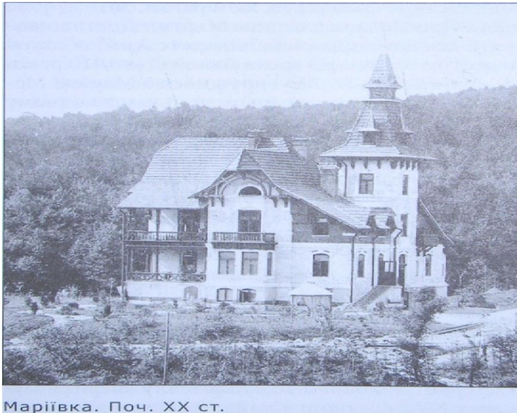
Рис.1. Відпочинково-лікувальний комплекс “Маріївка”.

Велике значення для формування рекреаційної функції приміської зони мала невеличка річка Марунька. Вона протікає через Винники. Її доброякісну воду вживали до пивоварення в лисиницькій броварні, що існувала перед першою світовою війною при джерелах Маруньки. В період між двома світовими війнами замість броварні побудовано фабрику дріжджей, яка затруювала повітря й воду в річці.