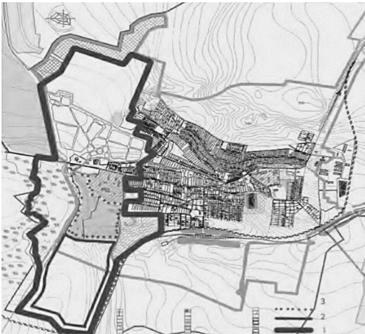
Рис. 4. Концепція розвитку рекреації в стм. Великий Любін

1 – межа курортно- рекреаційної зони ; 2 – межа проектованої рекреаційної зони; 3 – межа існуючої курортної зони.