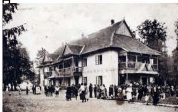
Рис. 3. Забудова курорту Великий Любін в першій чверті ХХст.

А. – загальний вигляд санаторію; Б. - танцювальна зала; В. – ресторан; Г. – каплиця в курортному парку; Д. – вілла-пансіонат