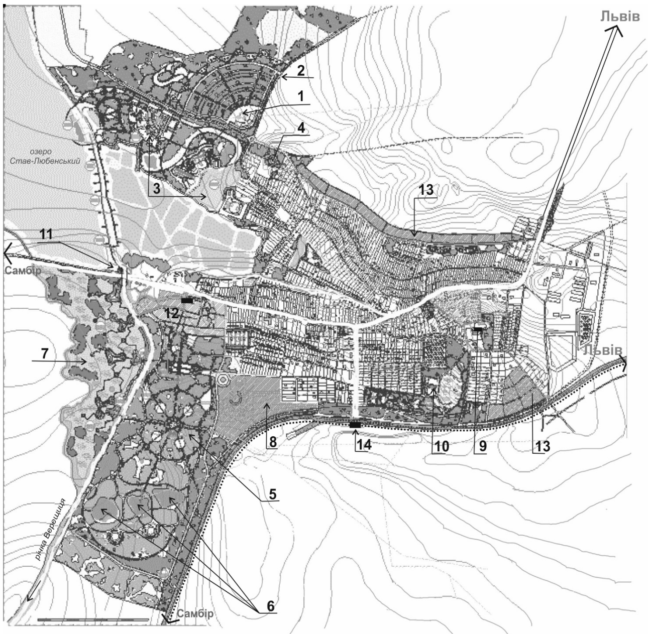
Рис. 5. Пропозиція архітектурно-ландшафтної реорганізації курорту Великий Любень. Генплан.

1 – кемпінг; 2 – спортивно-відпочинкова база; 3 – меморіальний парк «Пагорб Слави»; 4 – мотель; 5 – історичний курортний дендропарк; 6 – прогулянковий парк березовий гай з зоною відпочинку «Лісові озера»; 7 – ландшафтний парк болотяної флори і фауни; 8 – реабілітаційний центр; 9 – територія школи-інтернату (палац Бруницьких - пам'ятка архітектури і пам'ятка садово-паркового мистецтва «Парк XVII ст.»); 10 – спортивний парк; 11 – оглядовий пішохідний міст з в'їзним знаком; 12 – санаторій Любень Великий; 13 – агрооселі; 14 – залізнична станція