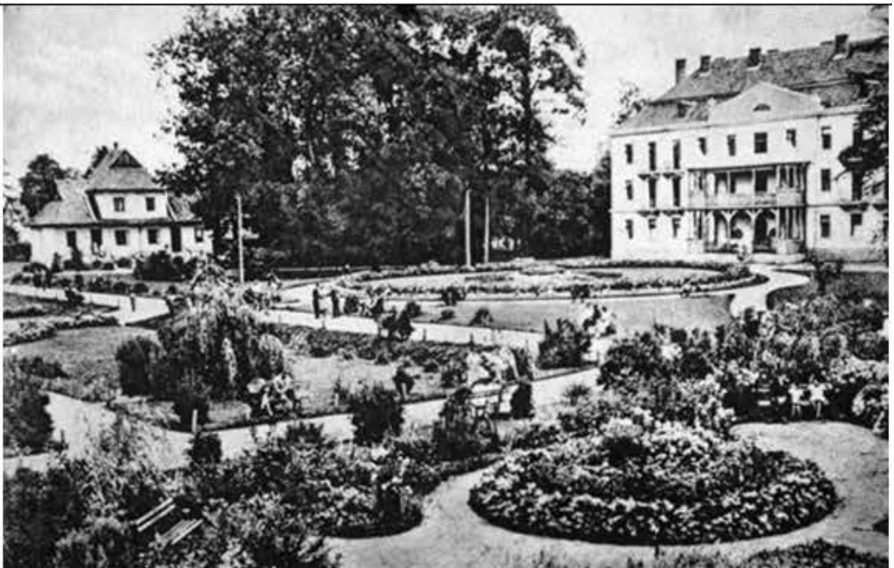
Курорт Великий Любінь – перша чверть XX ст.