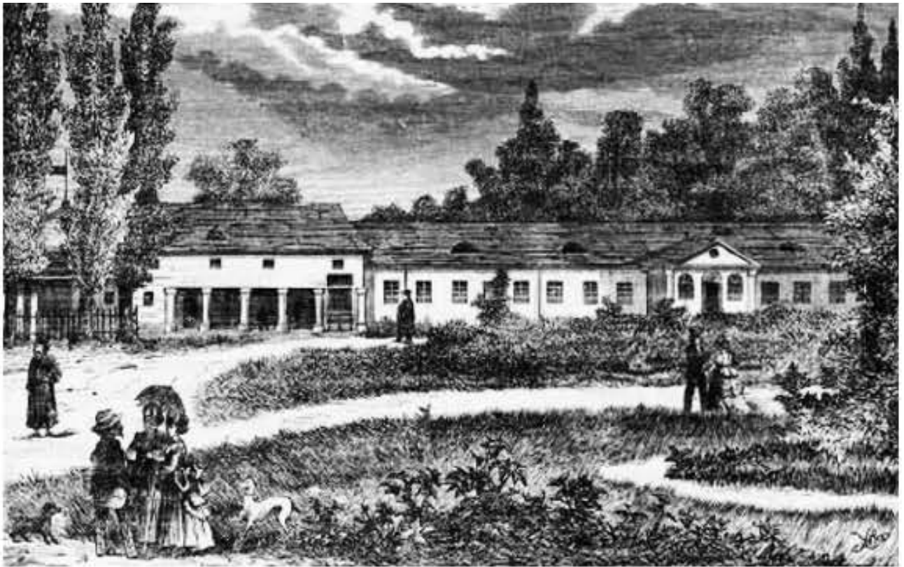
Курорт Великий Любінь – кінець XVIII ст.