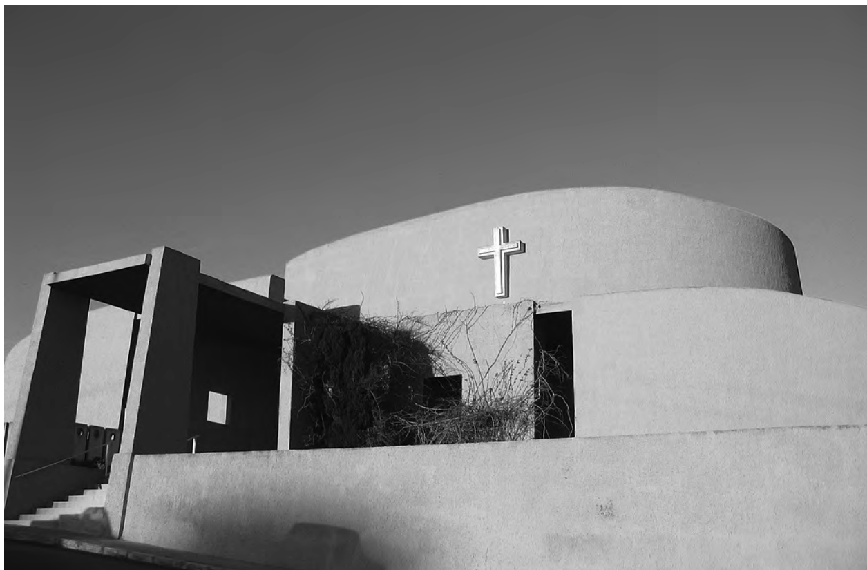
Рис 1. Храм св. Йосипа, с. Маніката, Мальта. Річард Інгланд, 1961