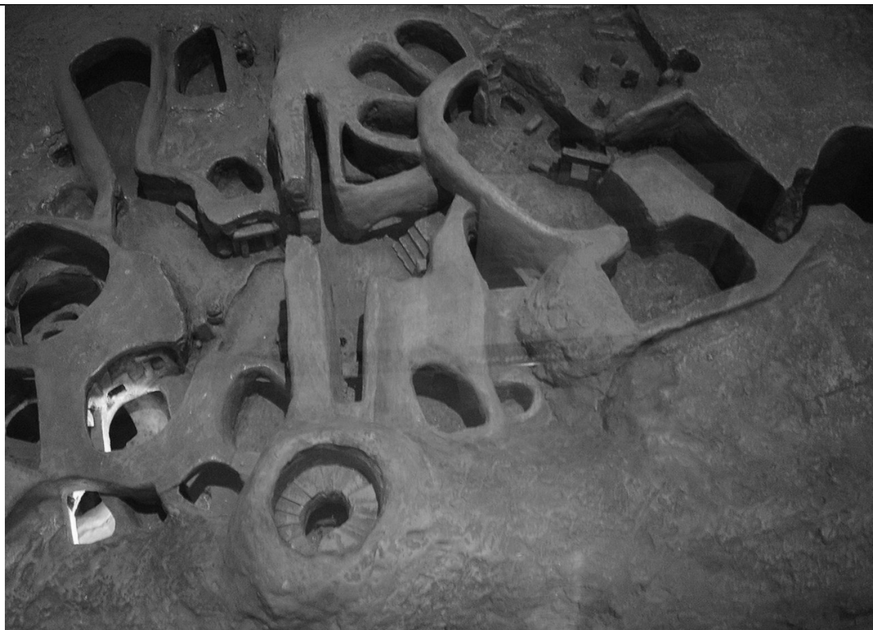
Рис 3. Модель гіпогею з основними приміщеннями, 4000 р. до н. е.

Висновок: Отже, з'ясовано, що сакральна архітектура відіграє особливу роль у великій творчій діяльності Річарда Інгланда.