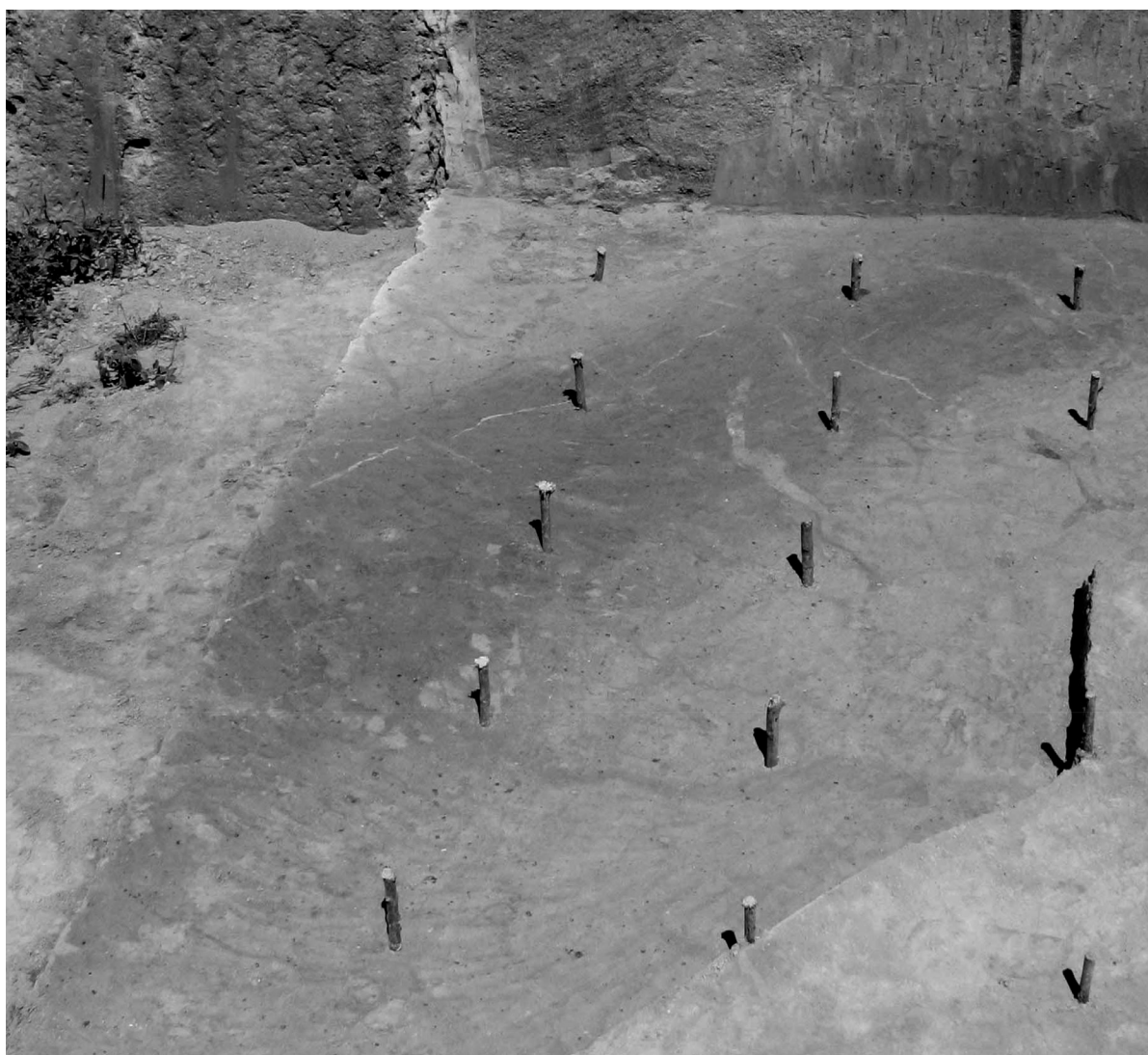
Рис. 2. Андріївка 4. Похований яр з матеріалами нижнього шару. План

Цілковита відсутність патини на поверхні кременів із заповнення яру та гарна збереженість кісток, вочевидь, пояснюється швидкою консервацією решток унаслідок інтенсивного накопичення відкладів у яру, тобто швидкого його заповнення суглинками. Натомість інтенсивна патинізація кременів верхнього шару свідчить про тривале перебування їх на поверхні, під дією руйнівних для них природних факторів: сонячної радіації, перепадів температур, вологості тощо. Адже стоянка верхнього шару