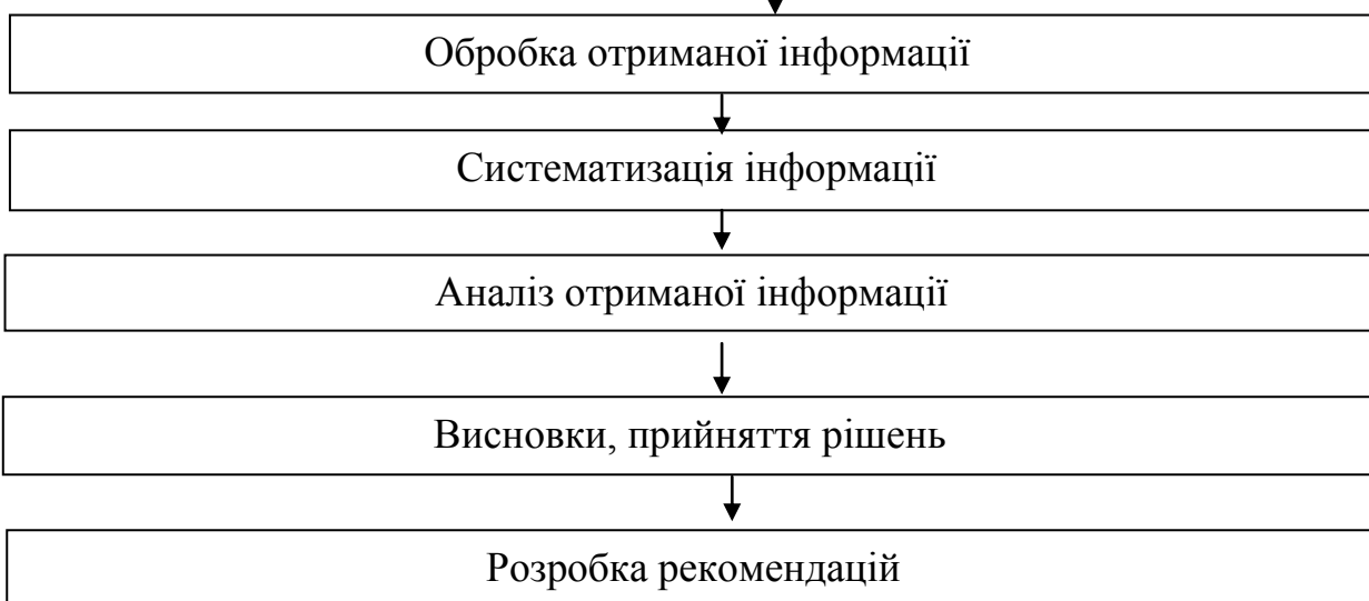
Рис.1 Модель моніторингу якості освіти у вищому навчальному закладі

Інтерпретація результатів обробки та коректність рішень, що приймаються, багато в чому визначаються способами подання (візуалізацією) результатів, які повинні бути максимально наочними, читабельними та інформативними. Наочність та висока інформативність – основні достоїнства когнітивної графіки, які досягаються