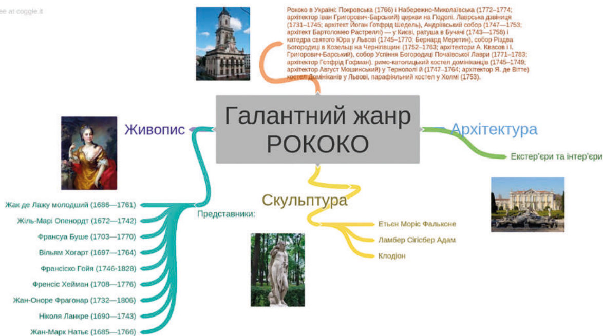
Рис. 4. Інтелект-карта «Стиль рококо»

Викладач, забезпечений комп'ютером, замість дошки та крейди отримує потужний інструмент для її представлення в різноманітних формах: текстовій, графічній, анімаційній, цифрового відео тощо. Здобуваючи інформацію в електронному вигляді, студенти позбавлені необхідності ведення конспектів і можуть уважніше прислухатися до коментарів лектора.