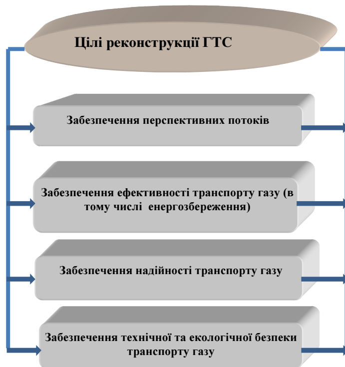
Рисунок 1 – Цілі реконструкції газотранспортної системи