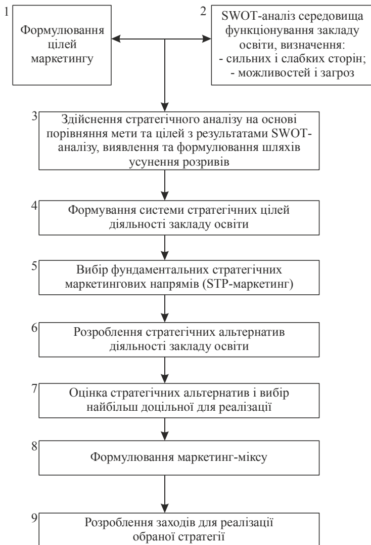
Рис. 1. Алгоритм формування маркетингової стратегії закладу освіти

Слід враховувати і той факт, що формування стратегії STP ускладнюється неоднозначністю сегмента, на який орієнтована освітня послуга. Йдеться про те, що людина у віці 16—18 років, на який, як правило, припадає вибір освітнього закладу і спеціальності взагалі, не завжди може здійснити цей вибір правильно. Це пояснюється такими причинами: розрив між бажаною професією та реальними здібностями й можливостями, відсутність (у більшості випадків) попереднього досвіду роботи і, як результат, абстрактне уявлення про відповідність майбутньої спеціальності й типу роботи взагалі власним здібностям і бажанням. Значна роль у виборі ВНЗ, як правило, належить батькам чи опікунам абітурієнтів. З одного боку, це підвищує практичну складову вибору та його реальність, що є позитивним, з іншого — зменшує