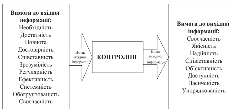
Рис. 1. Вимоги до вхідної та вихідної інформації в процесі реалізації контролінгу

- зростання нерівномірності соціально-економічного розвитку регіонів;