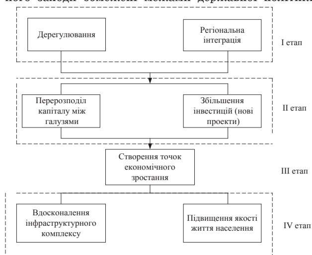
Рис. 3. Взаємозв'язок між результатами реформування моделі економіки України

Дерегулювання створює умови для поживлення економічного розвитку країни та її регіонів, проте його заходи обмежені межами державної політики