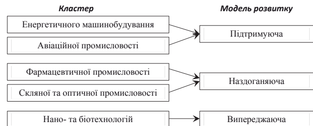
Рис. 4. Основні промислові інноваційні кластери в Харківській області та моделі їх розвитку

У Стратегії-2020 було ідентифіковано п'ять основних промислових інноваційних кластерів та визначено моделі їх розвитку (рис. 4).