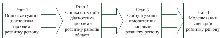
Рис. 2. Основні етапи вибору пріоритетних напрямків стратегічного розвитку регіону

новано здійснювати на основі наукового підходу за допомогою: матриці життєвого циклу і цілей розвитку регіону; нейросітових карт Кохонена; SWOT – аналізу стану галузей і виробництв.