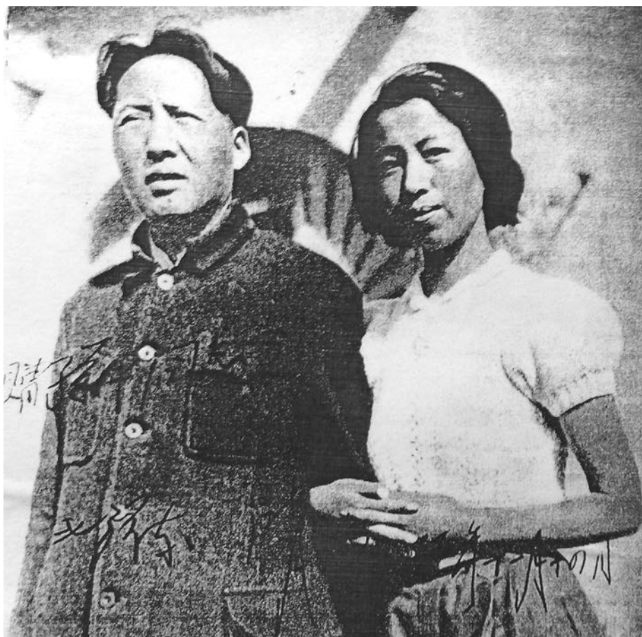
Фото Мао Цзедунa і Цзян Цін, яке вони подарували П.П. Владімірову (Сун Піну) 14 листопада 1945 р.