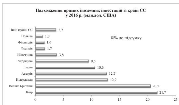
Рис. 3. Обсяги надходження прямих іноземних інвестицій із країн ЄС у 2016 р. [7]

Досліджуючи рівень інвестиційних надходжень із країн ЄС в економіку України, важливим є те, що ці інвестиції становлять приблизно 44,7% від загального обсягу інвестицій за 2016 р., що в реальному відношенні становить 972 млн. дол. США. До найбільших інвесторів Європи незмінно належать Кіпр (427,7 млн. дол.) та Велика Британія (403,9 млн. дол.) (рис. 3) [7].