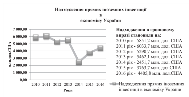
Рис. 1. Обсяги надходження прямих іноземних інвестицій в економіку України [7]

Із даних рис. 1 видно, що протягом 2013–2016 рр. обсяг прямих іноземних інвестицій зменшився на 19,3%, що становить 1 056,3 млн. дол. США, спостерігалися значні коливання іноземного капіталу. Вже в 2015 р. інвестиції надходили зі 133 країн світу і становили 3 763,7 млн. дол. США.