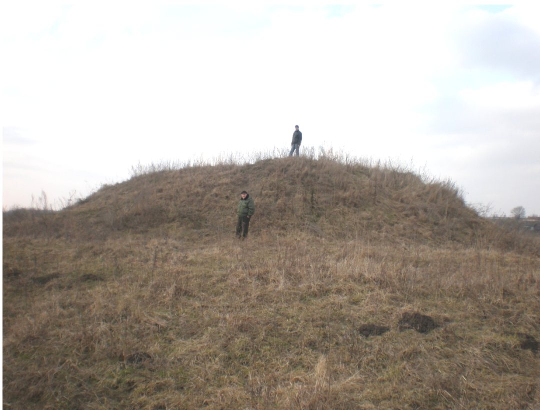
Рис. 3. Стіжок городища у с. Фалемичі.