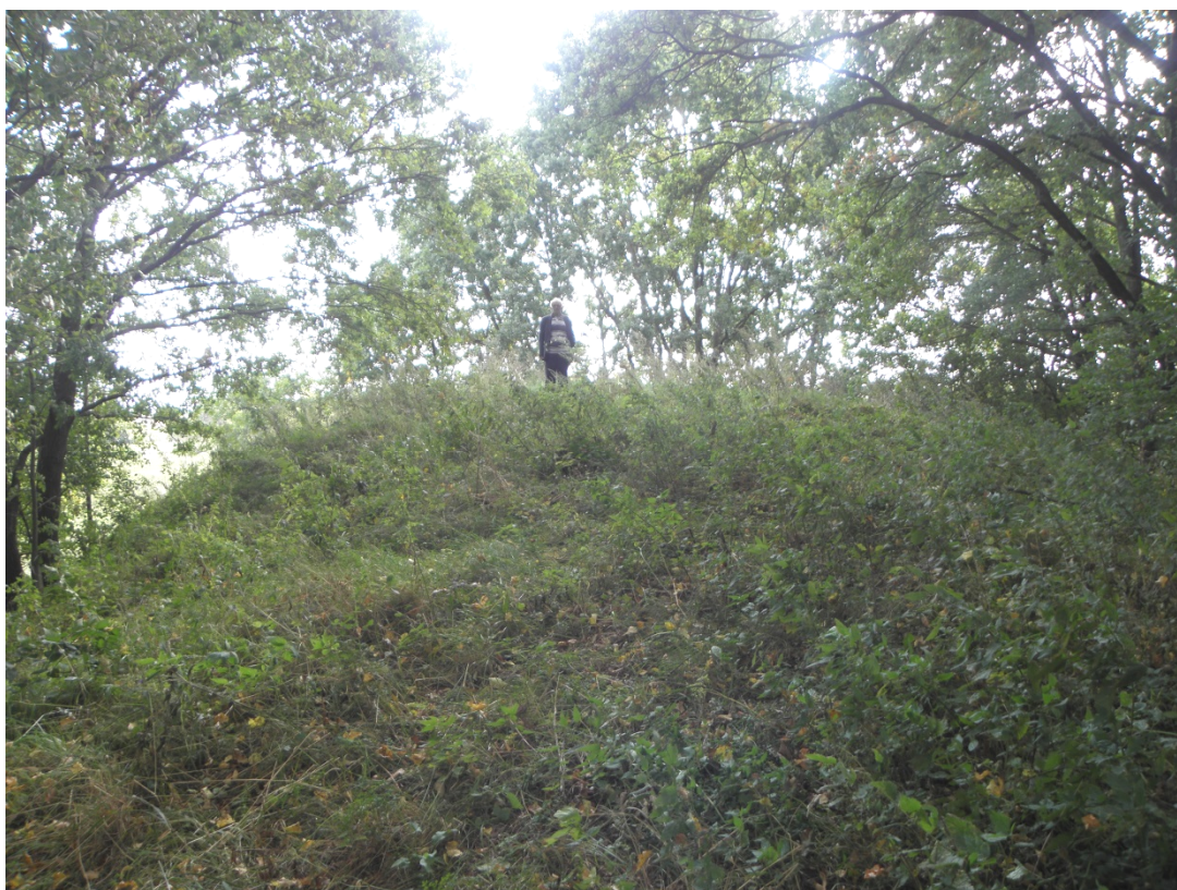
Рис. 4. Стіжок городища у с. П'ятидні.