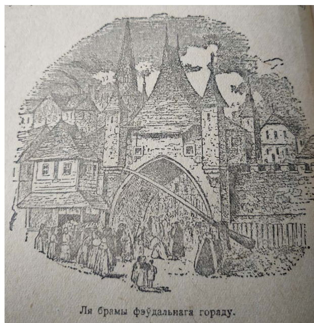
Ля брамы феўдальнага гораду.

історичної перспективи, а ретроспективи, що порушує принцип історизму. Для формування негативного образу використовується метод порівняння: «Абсталияваньне ў доме было зусім просая: замест шафаў – скрині, замест кресаў – лавы...» [5, с. 43] Підбиваючи підсумки опису феодального міста автор закликає учнів уявити картину життя міщан: «вы ўявіце сабе выразны малюнак з жыцця гарадзкого насельніка ў тых часы. Цесната, бруд на ўуліцах і в дамох, цяжкі дух на вуліцах ад куч смецця і адкідаў вылікалі часты епідэміі, якія зьнішчалі значную колькасць насельніцтва. У XV стагодзьдзі ад такой епідэміі – ад чумы, вбо ад так званай «чорнай сьмерці» загінула 1/3 частка ўсяго насельніцтва Эўропы» [5, с. 43].