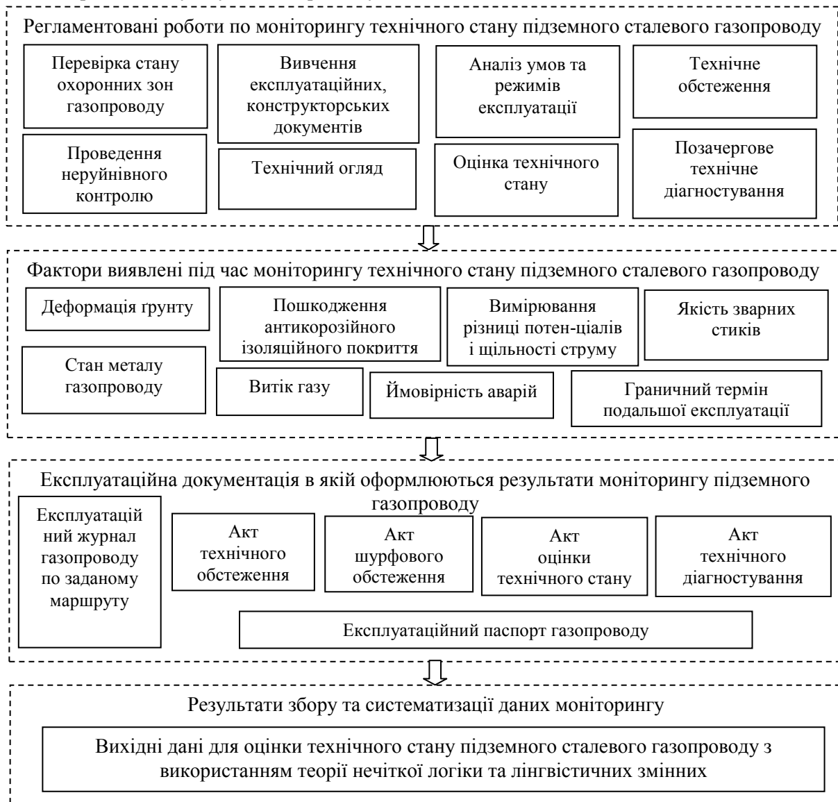
Рис. 1. Структура системи моніторингу технічного стану підземних сталевих газопроводів

дозволяє визначити фактори впливу на технічний стан газопроводів, які характеризуються найбільшим ризиком. Це в подальшому визначає напрямок розроблення експертно-аналітичних управлінських заходів з оцінки надійності підземних сталевих газопроводів. При проведенні моніторингу технічного стану підземних сталевих газових мереж для встановлення пріоритетності факторів впливу на виникнення аварій на їх спорудах використано методи Парето та ABC-аналізу [12]. Після використання даних методів виявлено, що найбільш впливовим фактором на технічний стан підземних газових розподільчих мереж та на виникнення аварійних ситуацій на них є стан металу газопроводу, тому він є ключовим фактором і підлягає розгляду в першу чергу. Окрім стану металу суттєвими факторами впливу, які необхідно враховувати при проведенні моніторингу та експертно-аналітичній оцінці надійності споруд зовнішньої газової мережі є помилки у динамічних розрахунках, стан антикорозійного ізоляційного покриття, механічні пошкодження при транспортуванні та монтажу газопроводів, помилки у гідравлічних розрахунках, технічний рівень обслуговуючого персоналу.