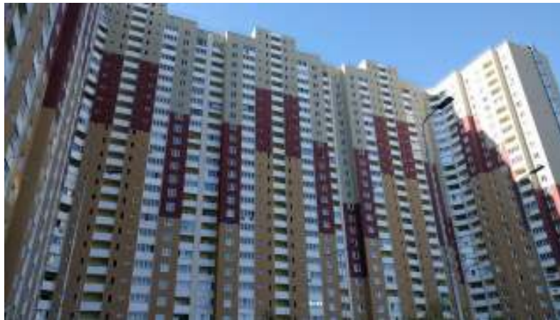
Рисунок 2 – Житловий комплекс «Крістер Град», вул. Сергія Данченко, 5

У Європі також будують панельні будинки. Олімпійське селище в Лондоні зводили використовуючи одношарові панелі, які утеплювали мінеральною ватою, і поверх утеплювача наносили архітектурний бетон (рис. 3). У Франції також є велика кількість багатоквартирних житлових будинків виготовлених з панелей. Можливо, на це вплинув той факт, що саме у Франції зародилась ідея зводити будинки з панелей. У Німеччині, коли вона була ще Німецькою Демократичною Республікою, також побудували багато панельних будинків, які були схожі на радянські панельки. Багато з них експлуатуються і нині, щоправда після процесу реконструкції (рис. 4).