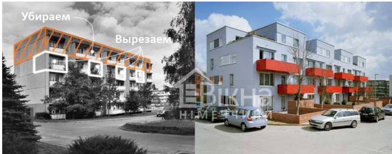
Рисунок 4 – Панельний будинок до та після реконструкції, Галле, Німеччина

Зведення будинків із тришарових стінових панелей має свої переваги та недоліки. Тришарова панель суцільного перерізу має зовнішній і внутрішній армовані бетонні шари, з важкого бетону, і теплоізоляційний шар, розташований між ними (рис. 5). Для теплоізоляційного шару тришарових панелей приймають жорсткі плити з пінополістиролу виду ПСБ-С, з пінопласту на основі резольних фенолоформальдегідних смол, фібролітові на портландцементі, а також плити мінераловатні на синтетичному зв'язуючому або зі скляного штапельного волокна. [4] Тобто така стінова панель має високі показники теплоізоляційних властивостей, легка у монтажі, має високу міцність в порівнянні з вагою.