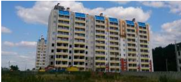
Рисунок 1 – Житловий комплекс в м. Вишневе, вул. Жовтнева, 34-Б (2 км. від Києва)

мінеральною ватою та облицюванням декоративною штукатуркою зводить будинки Домобудівний комбінат 4. Одна із трьох існуючих 25-поверхових будівель зображена на рис. 2.