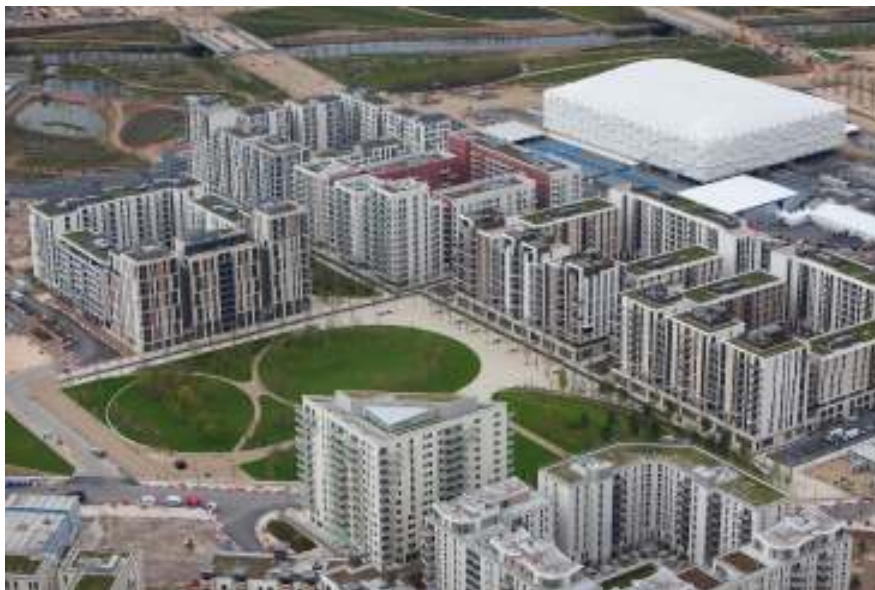
Рисунок 3 – Олімпійське селище, Лондон, Велика Британія, 2012 р.

У Європі також будують панельні будинки. Олімпійське селище в Лондоні зводили використовуючи одношарові панелі, які утеплювали мінеральною ватою, і поверх утеплювача наносили архітектурний бетон (рис. 3). У Франції також є велика кількість багатоквартирних житлових будинків виготовлених з панелей. Можливо, на це вплинув той факт, що саме у Франції зародилась ідея зводити будинки з панелей. У Німеччині, коли вона була ще Німецькою Демократичною Республікою, також побудували багато панельних будинків, які були схожі на радянські панельки. Багато з них експлуатуються і нині, щоправда після процесу реконструкції (рис. 4).