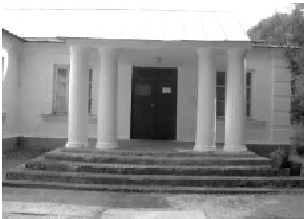
12. Будинок культури. Фото 2019 р.