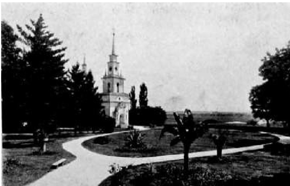
4. Партер перед садибним будинком. Фото початку XX ст.