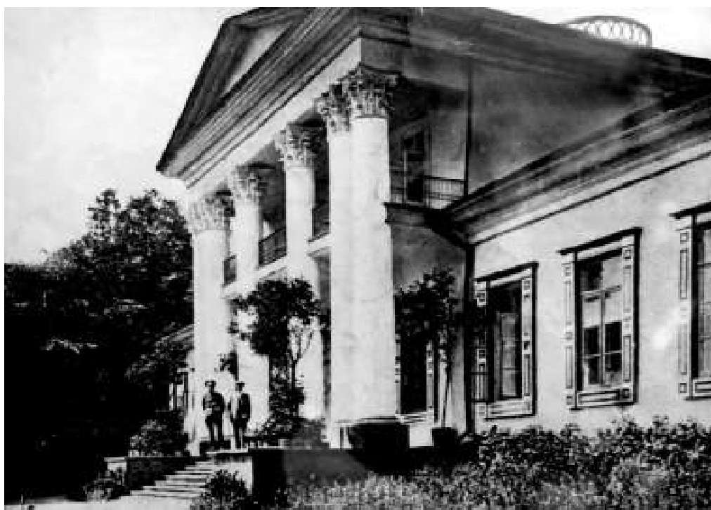
3. Передній фасад садибного будинку. Фото початку XX ст.