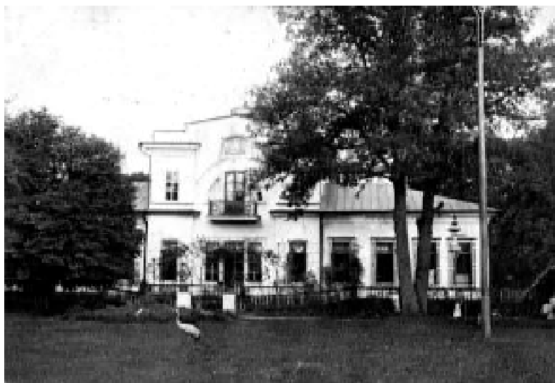
14. Задній фасад садибного будинку. Фото початку XX ст.