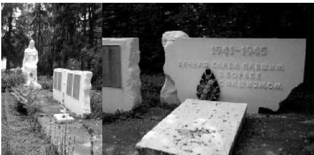
5. Меморіал загиблим у Другій світовій війні. Фото 2019 р.