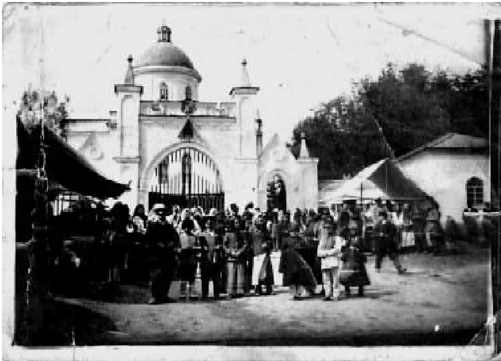
1. В'їзні ворота. Фото кінця XIX - початку XX ст.