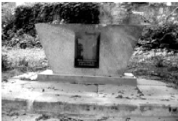
13. Знак в пам'ять про М.А. Миклашевського та Покровську церкву.