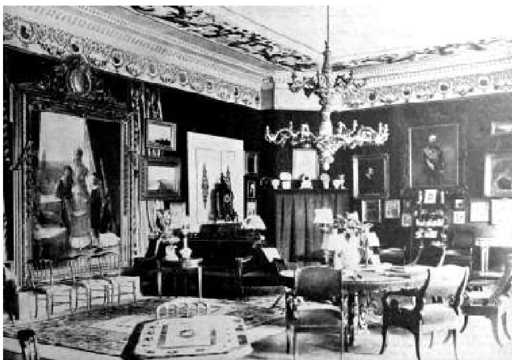
6-7. Інтер'єр зали та кабінету садибного будинку. Фото початку XX ст.