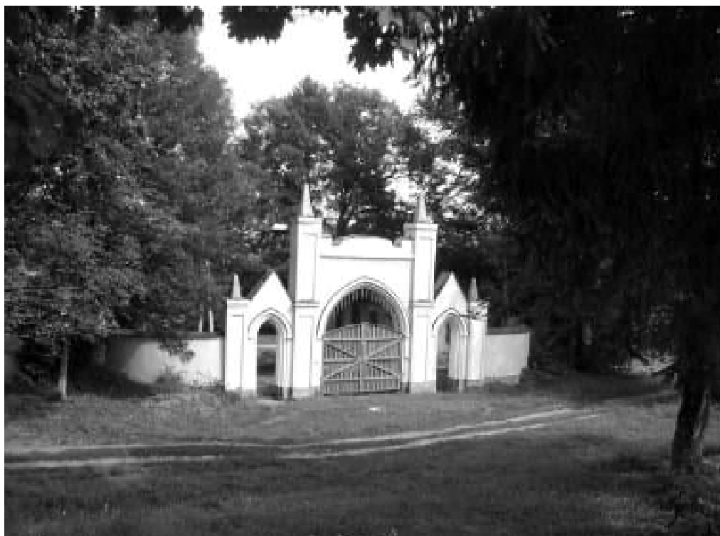
2. В'їзні ворота. Фото 2019 р.