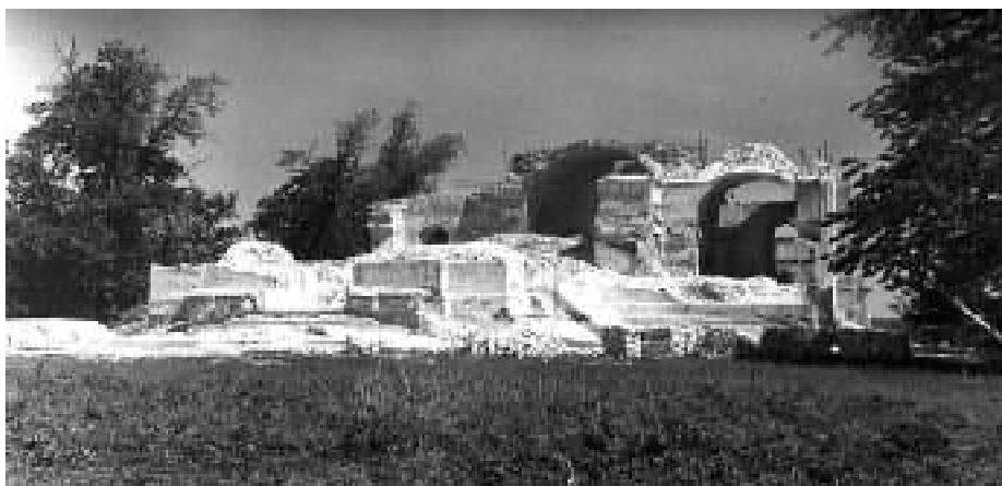
11. Руїни Покровської церкви. Фото М. Цапенка 1958 року. Джерело: Вечерський В.В. Втрачені об'єкти архітектурної спадщини України. - Київ: НДІТІАМ: Головкивархітектура, 2002. С. 272.