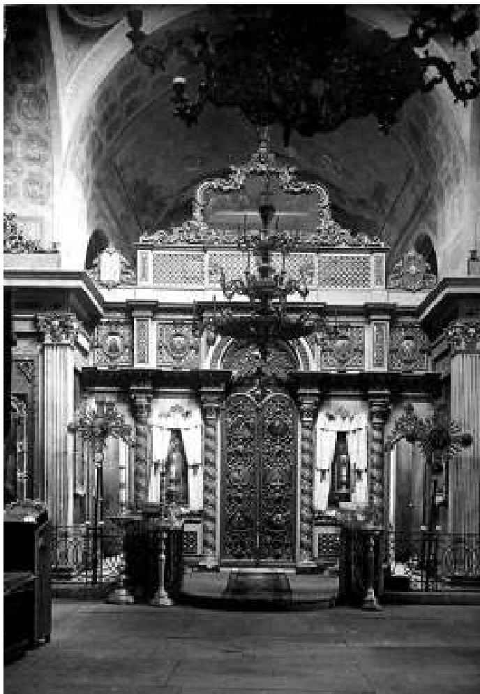
10. Інтер'єр Покровської церкви з іконостасом. Фото Є. Спаської 1930-х рр. Джерело: Вечерський В.В. Втрачені об'єкти архітектурної спадщини України. Київ: НДІТІАМ: Головкивархітектура, 2002. С. 272.