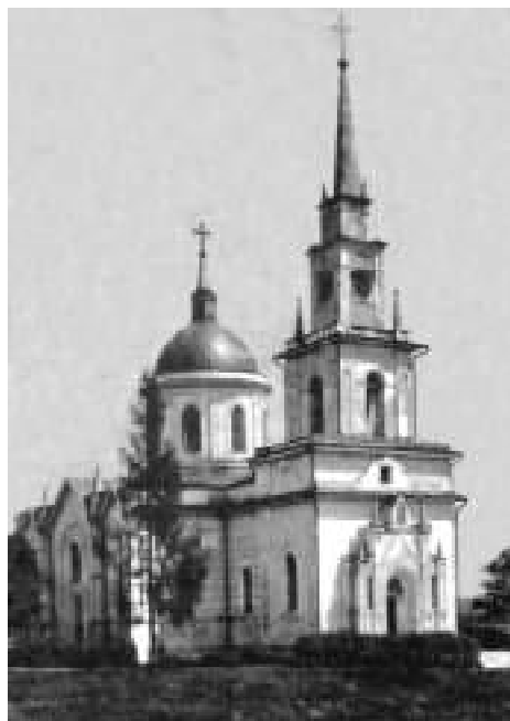
9. Покровська церква. Фото кінця XIX ст.