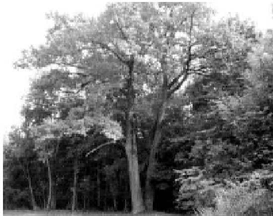
15. Чотирьохсотрічний двостовбуровий дуб на галявині, на яку виходив задній фасад садибного будинку.