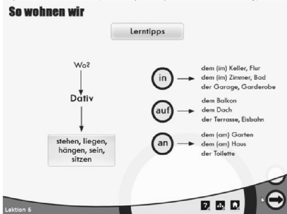
Рисунок 1. Зразок граматичного довідника у НМК

Приклад граматичного довідника (комп’ютерні матеріали до НМК для 7 класу) наведено на рис. 1.