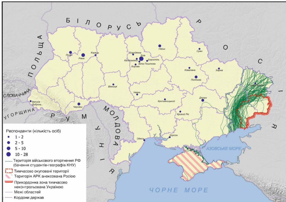
Рис. 1. Локації місць анкетного опитування та сприйняття тимчасово окупованих територій України студентами - географами