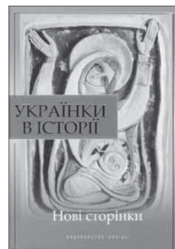
«Українки в історії»