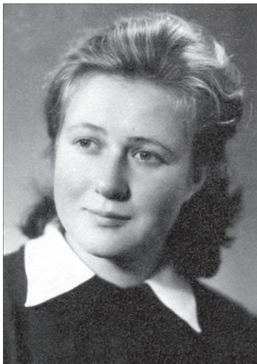
Студентка 1 курсу КДУ ім. Т.Г.Шевченка, 1963 р.

«Взаємозв'язки у традиційній культурі і побуті українців і поляків Поділля в кінці XIX – на початку XX ст.».