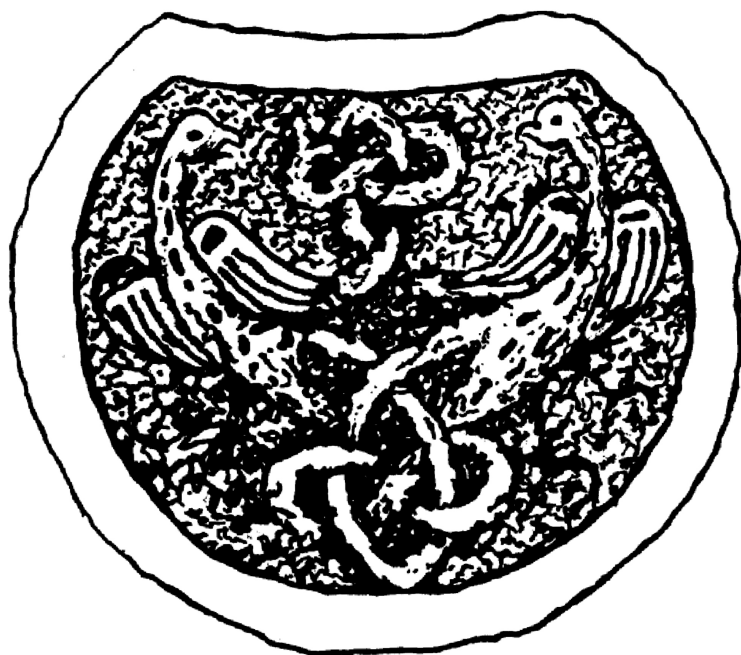
Рис.2. Матриця з бронзи для виготовлення золотих і срібних прикрас-колтів. холм. Розкопки 2001 р.