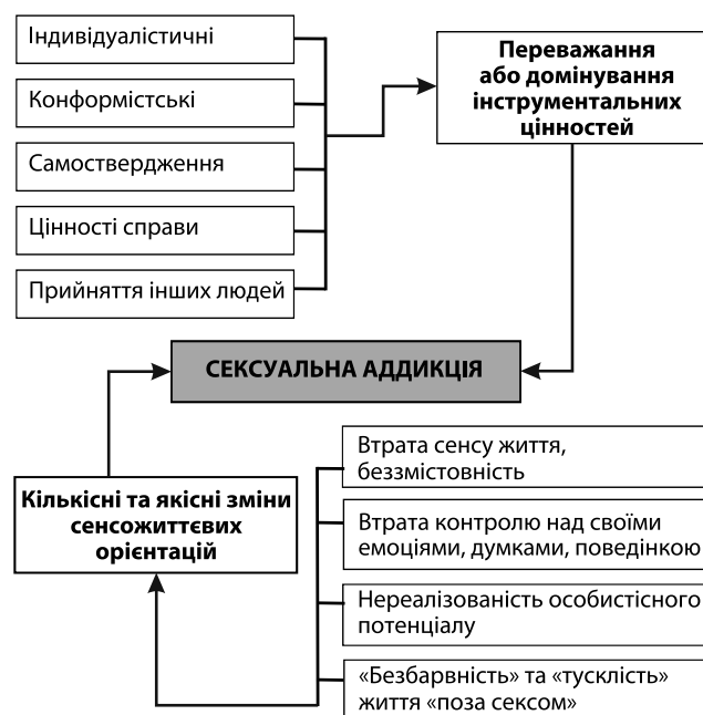
Рис. 3. Вплив зміни сенсожиттєвих орієнтацій та життєвих цінностей на формування сексуальної адикції

На рис. 3 схематично відображено вплив зміни сенсожиттєвих орієнтацій та життєвих цінностей на формування СА.