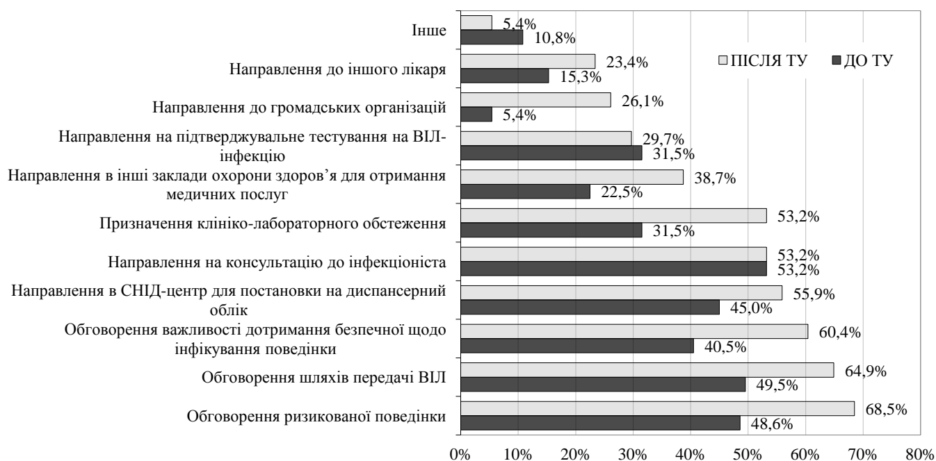
Рис. 3. Дії сімейного лікаря після виявлення ВІЛ-позитивного статусу пацієнта до та після циклу тематичного удосконалення

За останній рік збільшилася кількість лікарів, які направляють пацієнтів із ВІЛ до громадських організацій – з 6 до 29 осіб. Також помітно збільшилася частка тих, хто направляє таких пацієнтів в інші заклади охорони здоров'я для отримання медичних послуг (з 22,5% до 38,7%) та призначає клініко-лабораторне обстеження (з 31,5% до 53,2%). Зросла частка лікарів, які направляють пацієнта до іншого лікаря (з 15,3% до 23,4%). Більше лікарів почали обговорювати з пацієнтом важливість дотримання безпечної щодо інфікування поведінки (з 40,5% до 60,4%). Серед решти рекомендацій збільшилась кількість обговорення ризикованої поведінки, шляхів передачі ВІЛ, направлення до СНІД-центру для постановки на диспансерний облік. На тому ж рівні залишилося направлення на консультацію до інфекціоніста (рис. 3).