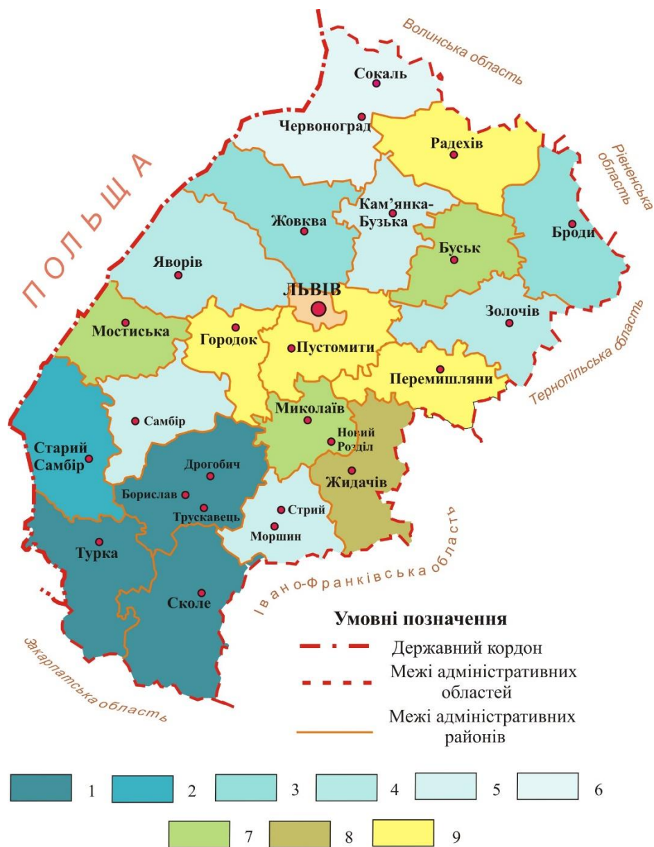
Рис. 1. Площі земель, зайнятих природними об'єктами поверхневих вод у користуванні лісгосподарських підприємств Львівської обл. станом на 2016 р., га: 1 – 196,1–98,1; 2 – 8,0–49,0; 3 – 48,9–24,5; 4 – 24,4–12,3; 5 – 12,2–6,1; 6 – 6,0–3,1; 7 – 3,0–1,5; 8 – 1,4–1,0; 9 – не зафіксовано

Fig. 1. Area of lands with natural surface water bodies owned and used by forestry enterprises within the administrative and territorial units of Lviv region as of 2016