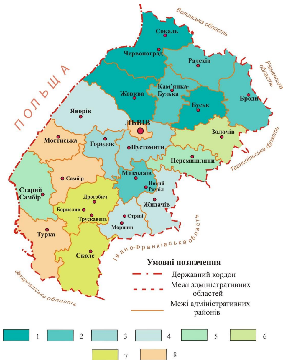
Рис. 2. Площі земель, зайнятих штучно створеними об'єктами поверхневих вод у користуванні лісгосподарських підприємств Львівської обл. станом на 2016 р., га:

1 – 309,0–154,5; 2 – 154,4–77,3; 3 – 19,2–9,7; 4 – 9,6–4,8;