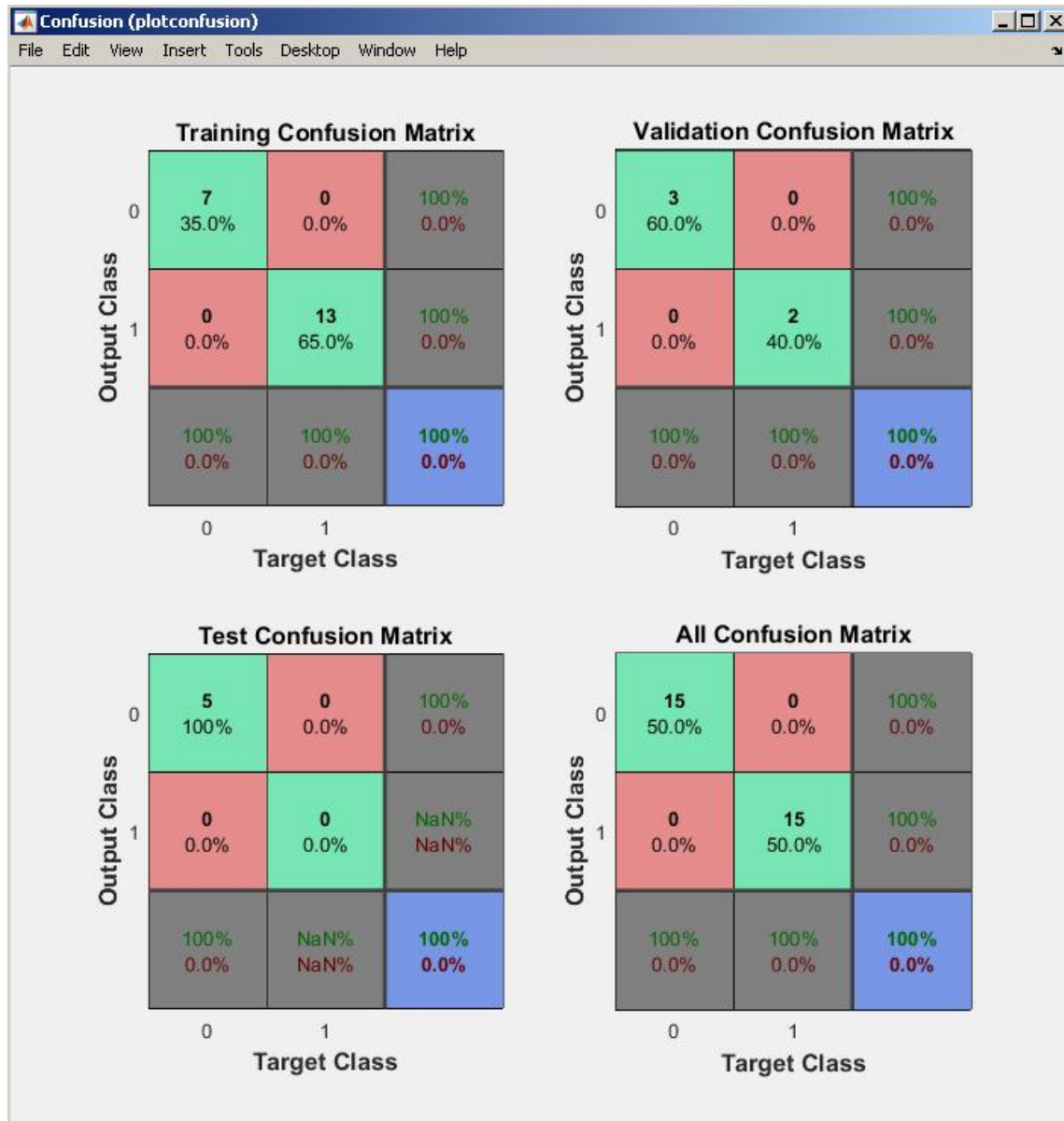
Рис. 2. Результат тестування роботи динамічної нейронної мережі

Для навчання нейронної мережі вибрано 20 пар входів-виходів (елементів), з них 13 елементів з резонансом та 7 елементів без резонансу, які були успішно запам'ятовані. При валідації вибрано 5 елементи з них 2 елементи з резонансом та 3 без резонансу, які були успішно розпізнані. Як тестувальні приклади було вибрано 5 елементів без резонансу, і всі вони були успішно розпізнані.