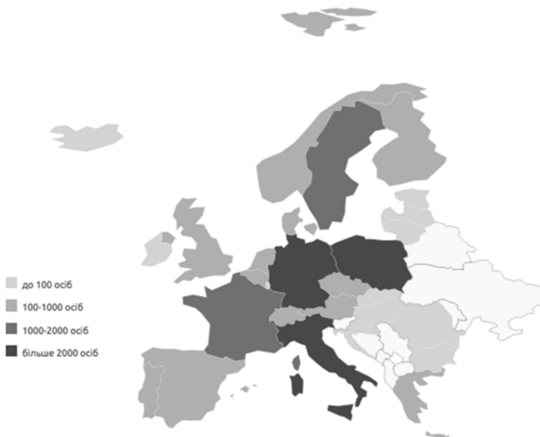
Рис. 3. Кількість поданих громадянами України заяв на отримання притулку в країнах ЄС у 2014 р.

Відповідно до розрахунків, які надає Управління у справах біженців ООН (УВКБ ООН), 314 000 осіб є шукачами притулку за межами України та 463 250 використовують інші механізми для того, щоб залишатися за кордоном. Щодо шукачів притулку в країнах ЄС, то на 2014 р. від громадян України було подано 14 405 прохань про притулок порівняно з 1120 у 2013 році. За цей період було розглянуто 1570 заявок, з яких щодо 420 рішення були позитивними (35 – статус біженця, 305 – додатковий захист, 80 – гуманітарні причини), 1150 було відхилено (рис. 3) [7].