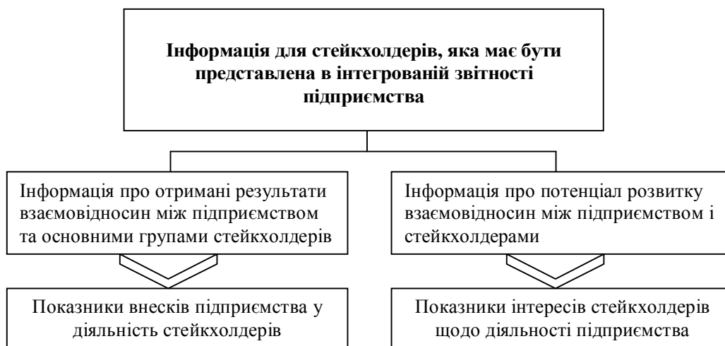
Рис. 2. Основні види інформації для стейкхолдерів, яка має бути представлена в інтегрованій звітності підприємства

2) інформація про особливості функціонування, конкурентну позицію, загальні результати і стратегію розвитку підприємства на ринку. Така інформація необхідна для того, щоб стейкхолдери могли оцінити потенціал розвитку взаємовідносин з підприємством відповідно до своїх потреб (див. рис. 2).