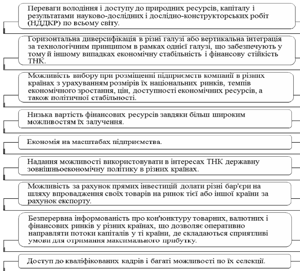
Рис. 1. Переваги ТНК

Головною причиною дуже стрімкого розвитку ТНК у другій половині XX ст. є висока ефективність їх діяльності в порівнянні з іншими компаніями. Таким чином виділяють конкурентні переваги, які є основою ефективної діяльності ТНК (рис. 1).